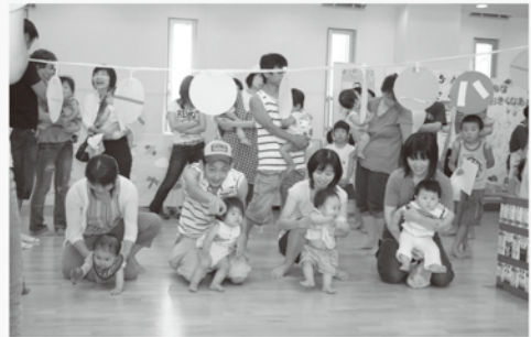
おっばいまつり ～赤ちゃんハイハイ競走～

幼稚園における菜園整備や稲作体験への地域の人々の参加をとおして、地域交流を深める。