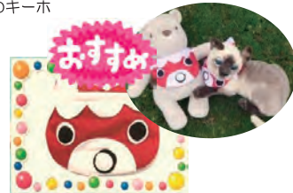
今、柳井で流行っているペット用の「金魚ちゃんパンダナ」おしゃれで可愛いでしょ！ペットちゃんも喜びます！ ¥850