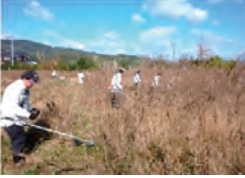
広大な場所の草刈り