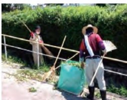
草刈・清掃作業中