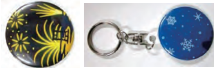
マグネットタイプのおしゃれな缶バッジ ¥100~