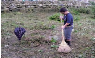
草刈及び草処分作業