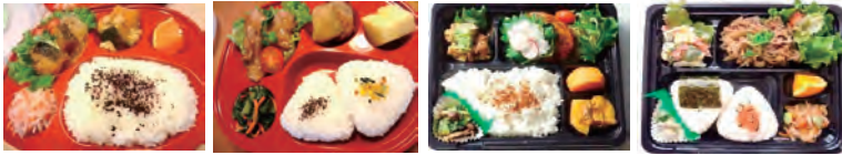
ヘルシーなお弁当 ¥400 (税込)