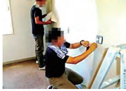
室内のリフォーム