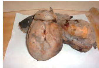
試作中の冷凍焼きいも ¥100～

農産加工品では、自分たちで育てた安納芋を、本物の川石で焼く「石焼きいも」を販売したところ、大変人気で、直ぐに売れてしまいます。そこで、この「おいしさ」をいつでも食べたいとの気持ちから、焼き芋の冷凍加工品にチャレンジしています。夏でも、この「ほくほく」のおいしい焼き芋をお客様にお届けすることが夢です。