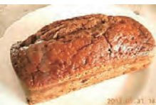
バナナケーキ ¥800 ほんのりレモンの香りと素朴な家庭の味がする定番ケーキです。

★各種ケーキ・お菓子 クルミアモンドケーキ マドレーヌ マロンケーキ オレンジケーキ いちじくケーキなど いずれも¥120 自然薯クッキー ジンジャークッキー レモンクッキー いずれも¥300 リンゴケーキ チョコレートケーキ バナナケーキ いずれも¥800 フルーツケーキ ¥1200