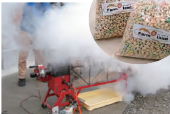
昔懐かしのボン菓子 (白米・玄米) ¥100