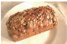
りんごケーキ ¥800 シナモンと生りんご、そしてクルミもたっぷり入った濃厚でボリュームのあるケーキです。