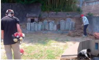
お墓の草刈り作業