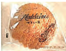
マドレーヌ ¥120 ほんのりレモンの香りと素朴な家庭の味がする定番ケーキです。