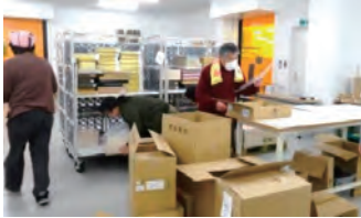
企業での商品管理業務