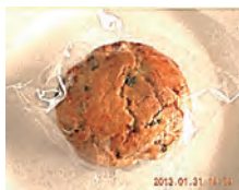
ティーケーキ ¥120 干しブドウとオレンジピールのプランデー漬けの入ったスコンのようなケーキです