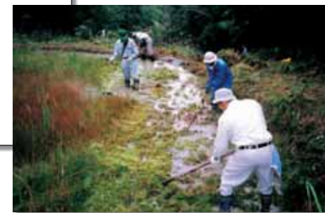
ナベヅルのねぐらの整備(周南市八代)