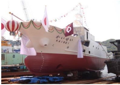
進水式（平成28年4月12日）