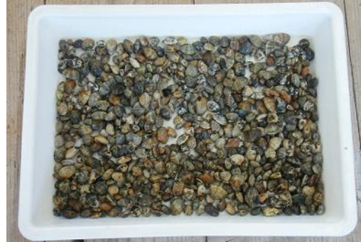
袋内部で見つかったアサリ稚貝 (584個 0.7kg)