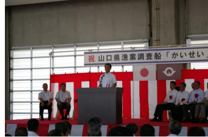
竣工式（平成28年8月2日）