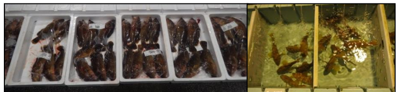
市場に出荷されたキジハタ