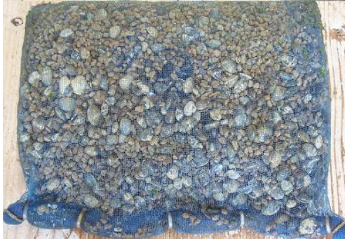
天然採苗されたアサリ稚貝

各地のアサリ漁場において天然アサリ稚貝を簡単に採取することが可能です。当所の事例では、種もみ袋の内部にボラ土（小粒）を収容し、秋（春先でも良いです）に干潟へ置くと、翌年秋には袋内部に殻長2cm前後のアサリ稚貝を多数見つけることができました（数量は干潟毎に違います）。袋の内容物は、ボラ土の他、砂利、砕カキ殻や砕瓦など粒状のものであれば差し支えありません。種もみ袋もボラ土等もホームセンターで購入できます。かつてのアサリ漁場で種場と呼ばれたような場所に設置するとより効果が期待できます。