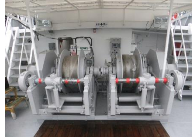
油圧トロールウインチ