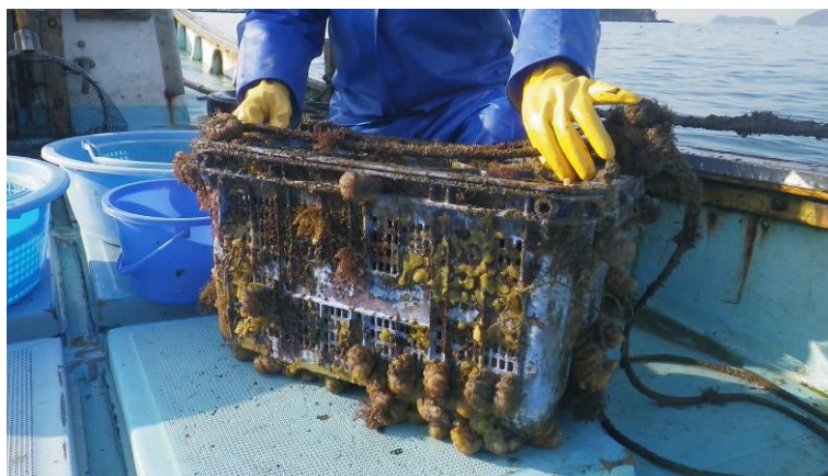
図 有害生物が付着した中間育成カゴ

上記の管理が遅れると、ムラサキイガイが籠内面に着生して足糸にからまれてへい死したり、籠の内外にフサコケムシ、ユウレイホヤ、カイメン類が着生して海水交換が悪くなって成長や歩留まりに影響する。また、イシガニ等のカニ類が浮遊幼生で籠内に進入し、大きな減耗を引き起こすことがしばしばあるので、こまめに有害生物の除去に努める 6) 。