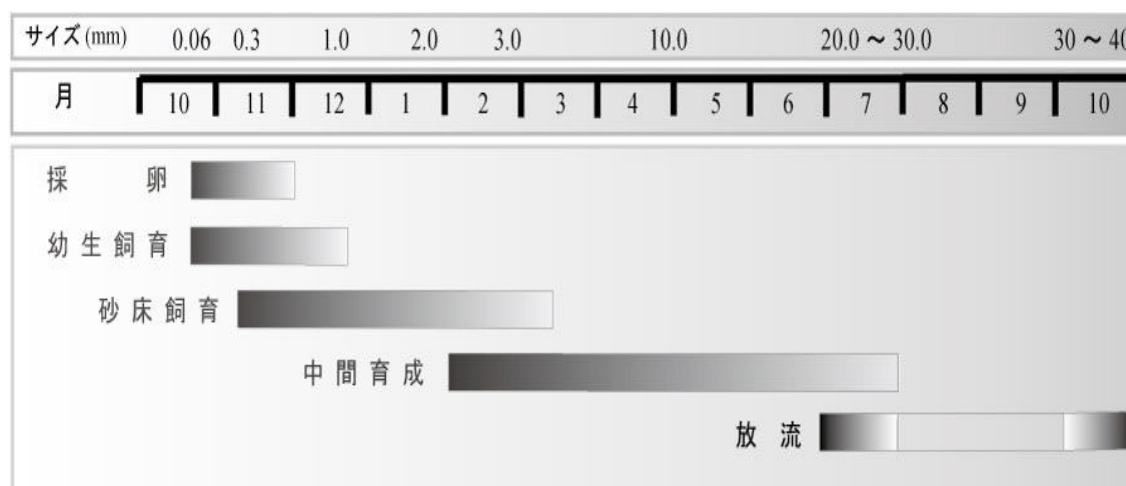
図3 採卵から取り上げまでのスケジュール

2~4月に殻長2~3mmに成長した個体から順次、海上垂下籠での育成等に移行する。取り上げた種苗は厚手のビニール袋に海水とともに適量ずつ分けて入れて、酸素封入し、10~15℃に保冷して運搬する。