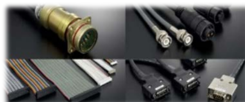
様々な仕様のワイヤーハーネス