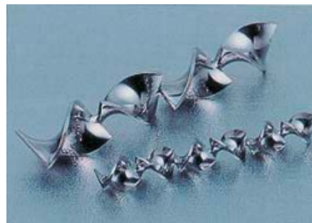
スタティックミキサー

又、写真のスタティックミキサー（静止型混練素子）の量産を 07 年度より開始しました。