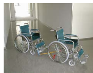
③車椅子の縦列連結装置の開発

連結装置の機構設計及び解析、後方車椅子操作の方向制御性解析、ワンタッチ着脱方法を開発しました。