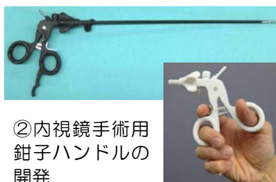
②内視鏡手術用 鉗子ハンドルの 開発

日本人の標準体型を意識したハンドルの設計、使い易さと簡易な機構のラチェット機能の設計、3Dモデル試作による官能評価試験を実施しました。