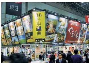
展示会への共同出展