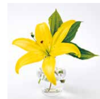
一輪ざしで 気軽に華のある生活を。