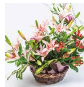
「和」の落ち着いた 雰囲気のアレンジに。