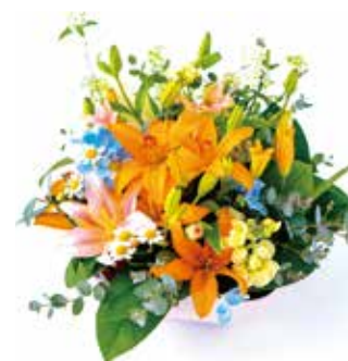
可愛らしくカジュアルな アレンジにも。