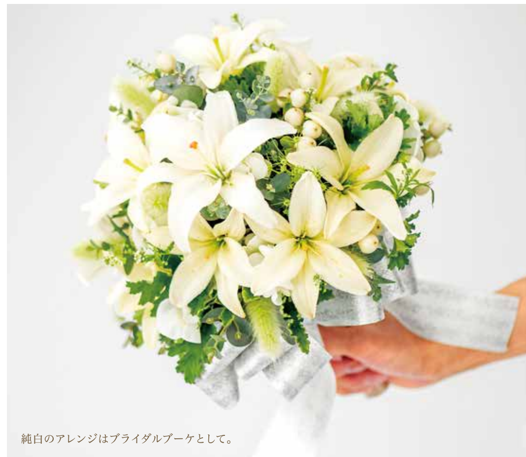
純白のアレンジはブライダルブーケとして。