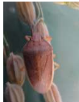
イネカメムシ 体長 12-13mm