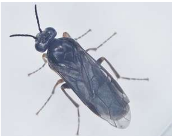
図5 成虫 (背面)