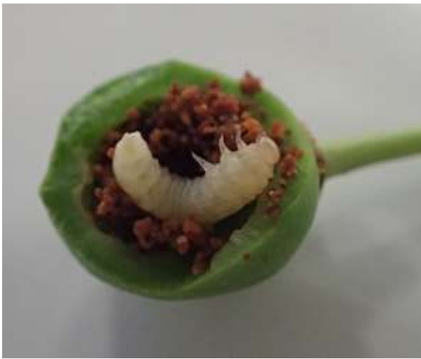
図1 幼果内部を食害する幼虫