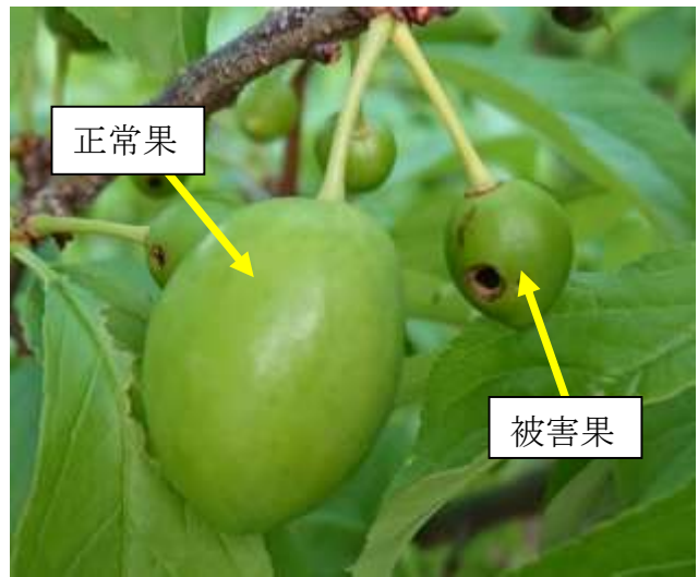
図2 正常果と被害果 (5月8日)