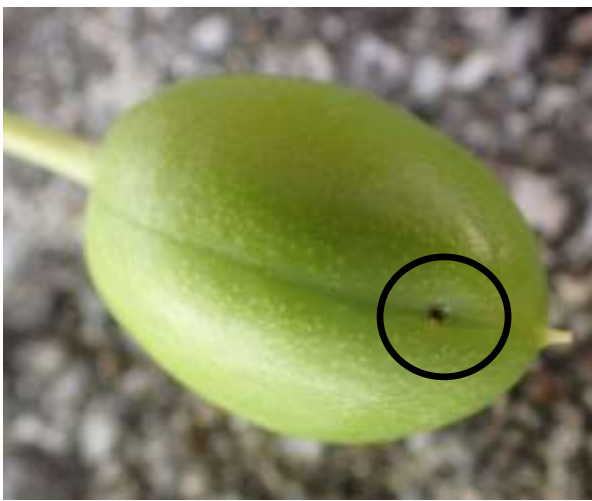
図3 幼虫侵入孔 (円中央)