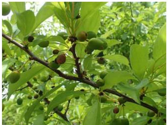
図4 甚発生状況 (全て被害果)