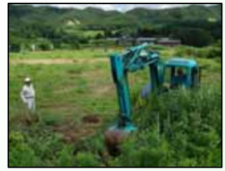
【再生作業(クボタプロジェクト)】