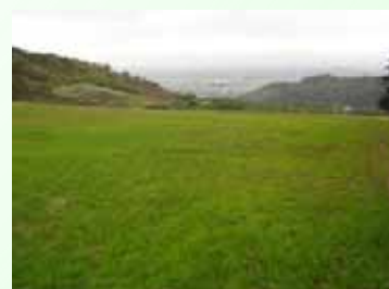
再生作業後(飼料用作物作付け)

問い合わせ先: 秋田県耕作放棄地対策協議会 018-860-1857(直通)(秋田県農山村振興課)