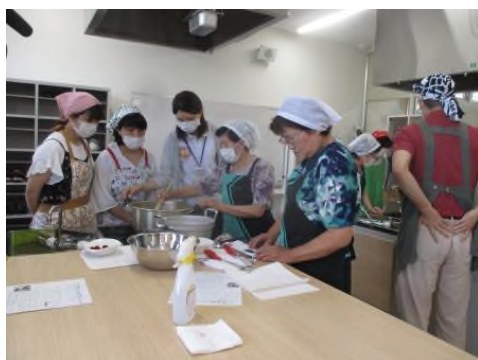
やまももジャムづくり体験

今年度は、新たに開設された直売所を活用して、生活改善グループが自らの知恵や技を用いて消費者に地域の農業や農家の暮らしを伝承する体験交流会を開催し、消費者から高い評価を得ることができた。高齢化し活力を失いつつある農村地域であるが、都市生活者からのニーズやそれに応える底力が農村女性にあることが確認できた。今後も、活動の理解者を増やすなど、生涯現役で活動できるしくみを検討したい。