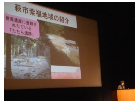
図2 管内女性フォーラムで紹介

今後は、法人組合員に広く女性部の活動を伝えるため、情報紙の発行を3月に予定している。