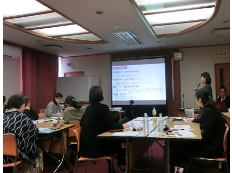
写真6) 経営指針発表 (B氏)