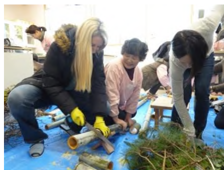
ミニ門松づくり体験