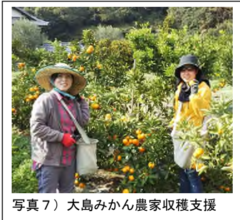
写真7) 大島みかん農家収穫支援