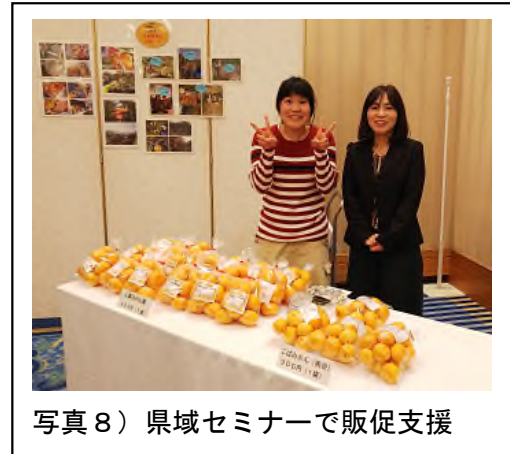
写真8) 県域セミナーで販促支援