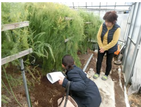
写真5) 先進農家の訪問 (A氏)

・受講後の復習や予習、欠席時のサポートを行った。 ・両者に先進的な農業経営を学びたいとの意向があったため、県内先進農家への視察の実施を行った。