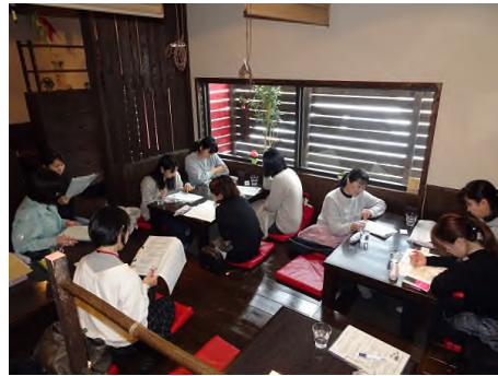
写真3) 農業女子会 (1月)