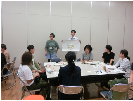
写真1) 改善士会との合同研修会