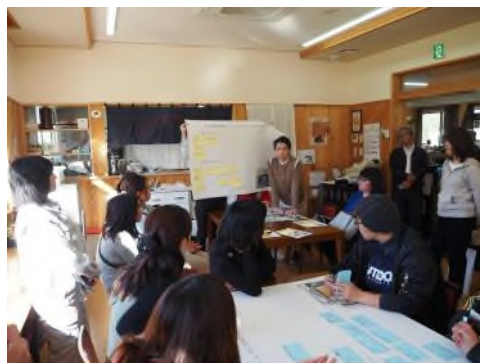
最先端の農業機械「わが家ならどう使う？」アイデア出し