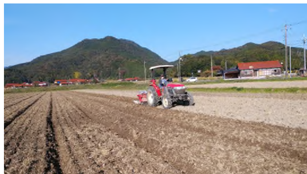
法人によるはだか麦の播種(11月)