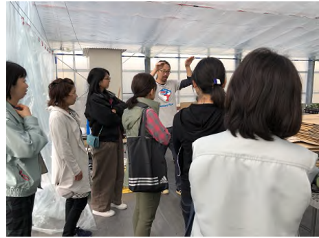
写真2) 農業女子会 (11月)