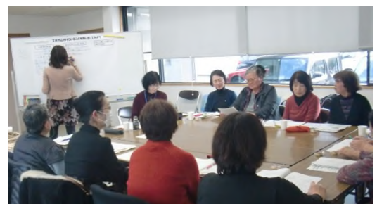
図3 法人女性交流会の様子