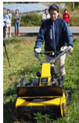
歩行型草刈機「プチもあ」を実演

また、未来のステキ女子を育てていくため、下関水産大学校の女子学生で構成される「吉見ガールズコレクション」代表にも女子会に参加してもらった。