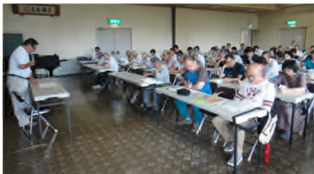
法人設立説明会(8月)

法人化により経営が組織化、大規模化したため、規模に応じた麦作、飼料米の効率的で安定した生産を指導する。