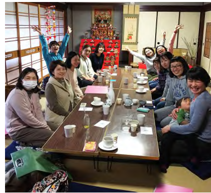
写真4) 農業女子会 (3月)