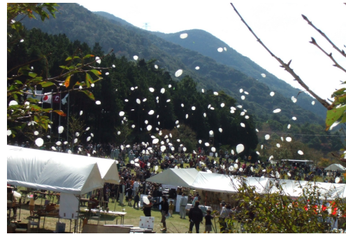
1000人の森林づくりメッセージ