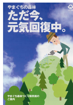
県民税事業を紹介するリーフレット