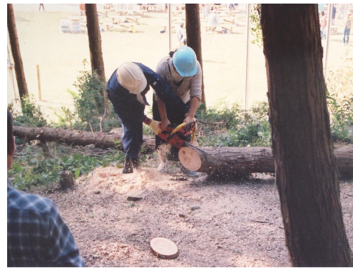
指導林業士による森林づくり教室