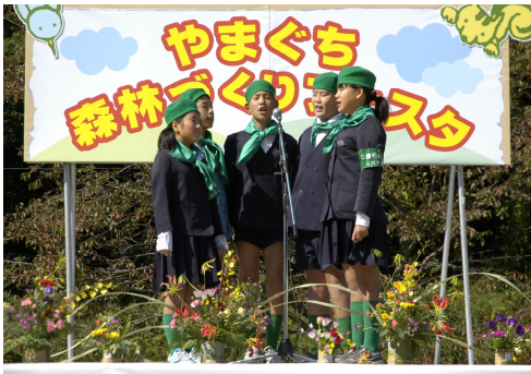
三豊緑の少年隊による森づくり宣言