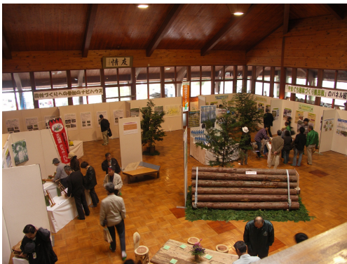
森林のパビリオンでの展示