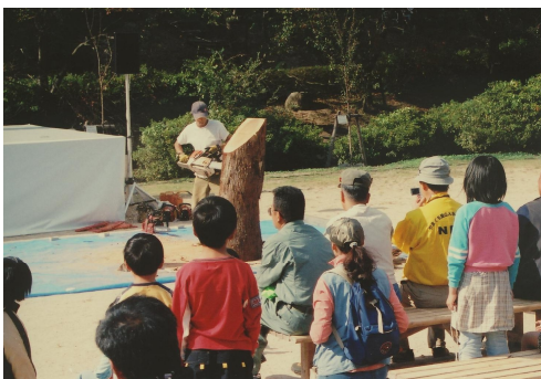
チェーンソーアート