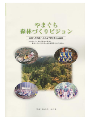
やまぐち森林づくりビジョン (平成16年3月策定)

このビジョンでは、百年先の豊かな森林の創造に向け、人と森林の関わり方を考慮して、本県の民有林を「自然を守る森林」、「水と緑を育む森林」、「循環利用される森林」、「生