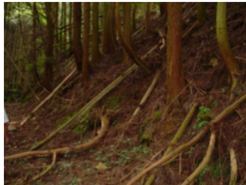
長期間放置され荒廃した森林（下草が枯れ、表土が流出し、樹木の根が露出している。）

荒廃した森林の緊急的な整備等を着実に進めるとともに、森林の果たす役割やその整備の重要性などについて県民理解を促進する取り組みなど、本県独自の新たな森林づくりを積極的に進めていくことが重要な課題となっています。