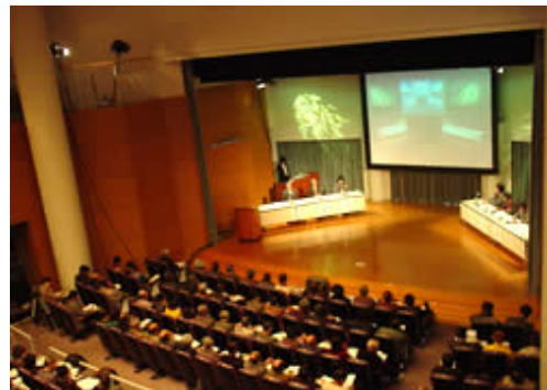
やまぐち森林づくりシンポジウムの開催(平成17年1月30日)

財源検討委員会の報告を踏まえ、山口県は「やまぐち森林づくり県民税(案)」を公表しました。テレビやラジオ、県のホームページなど各種広報媒体を活用した広報活動、県内10箇所での県民説明会、森林シンポジウムの開催などによる周知を行うとともに、パブリックコメントやシンポジウムの実施時のアンケート調査など幅広い意見の聴取に努め、また、県議会での審議を経て、平成17年4月から「やまぐち森林づくり県民税」を導入することが決まりました。