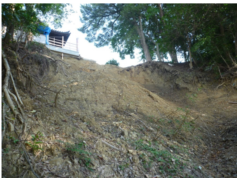
▲和歌山県田辺市 高山寺地すべり復旧工事