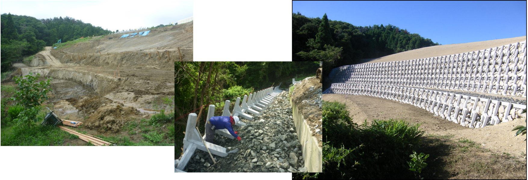
▲茨城県日立市 東日本大震災 工業団地崩壊法面復旧工事