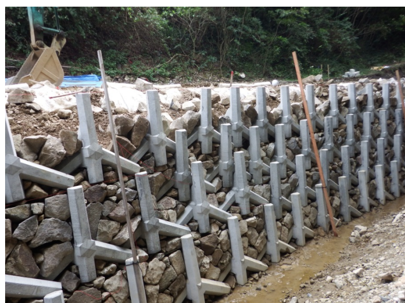
▲萩市須佐 災害復旧工事