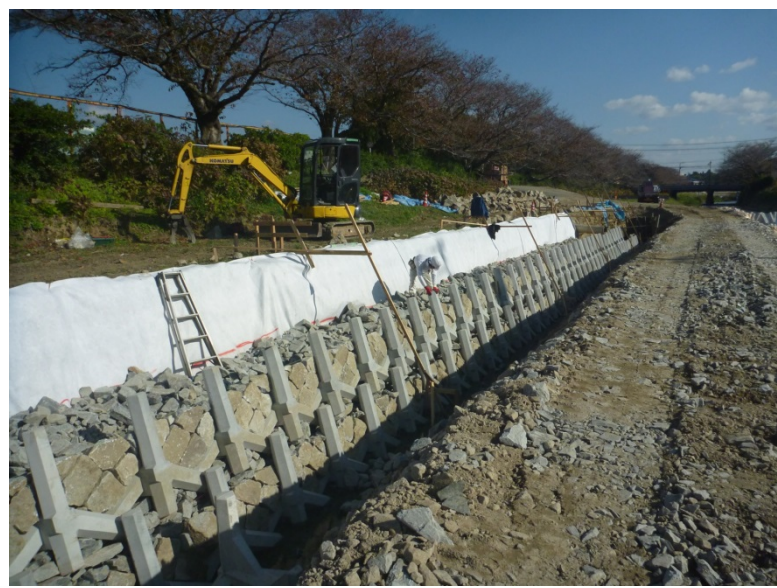
▲下松市 河川改修工事