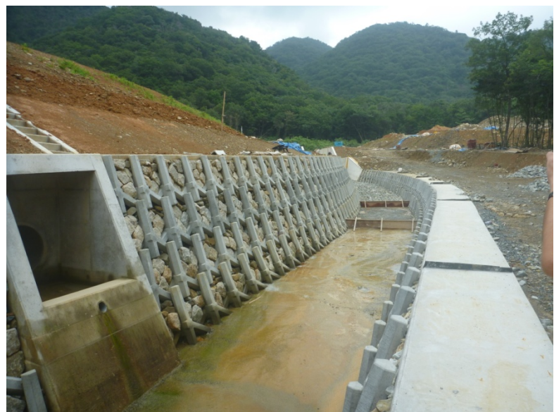
▲山口市系根新堤 農業用ため池改修工事 放流水路工