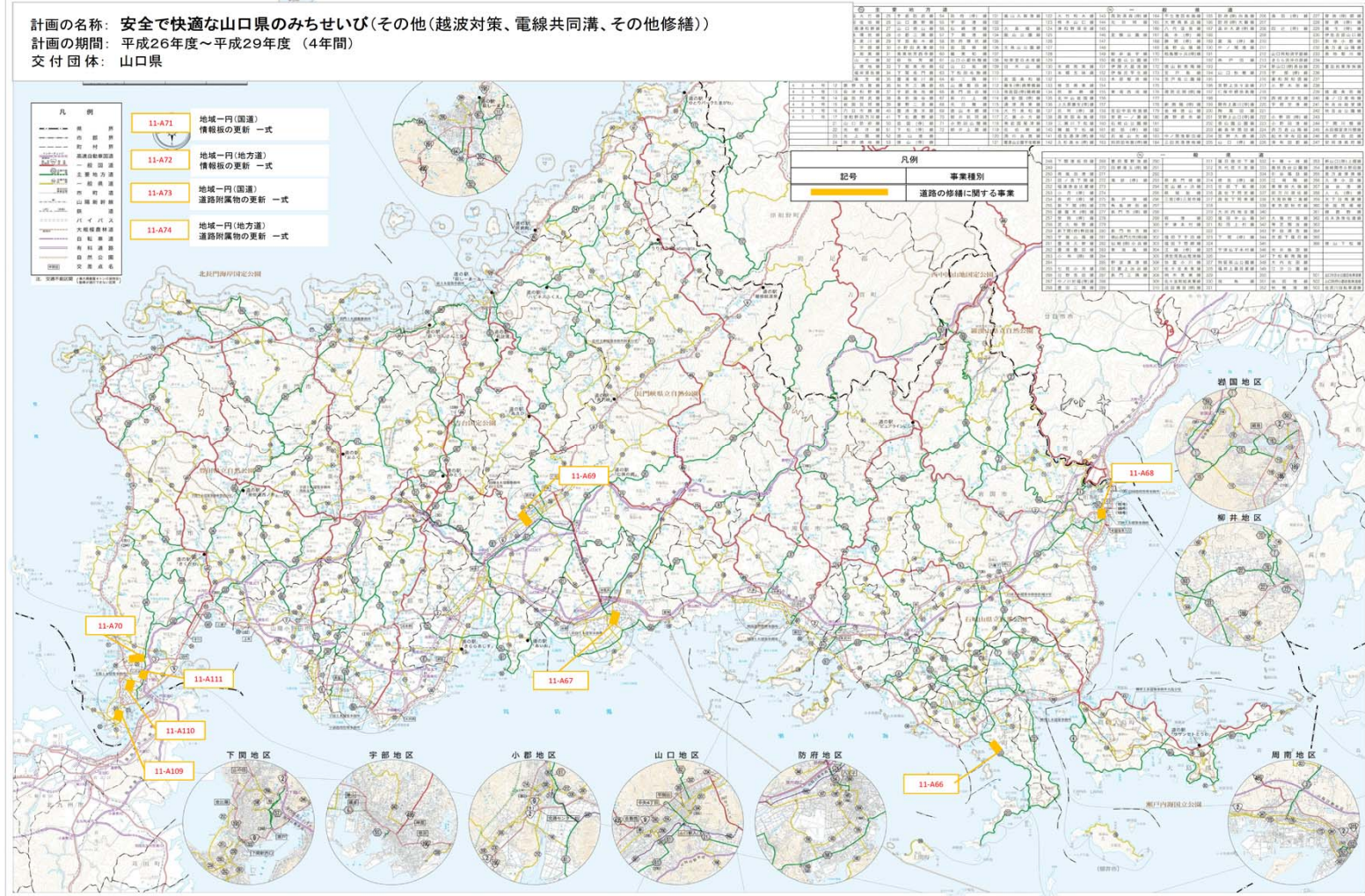
「この地図の作成に当たっては、国土地理院長の承認を得て、同院発行の20万分1地勢図を使用した。(承認番号 平26 中使、第3号)」

計画の名称: 安全で快適な山口県のみちせいび(その他(越波対策、電線共同溝、その他修繕)) 計画の期間: 平成26年度～平成29年度 (4年間) 交付団体: 山口県