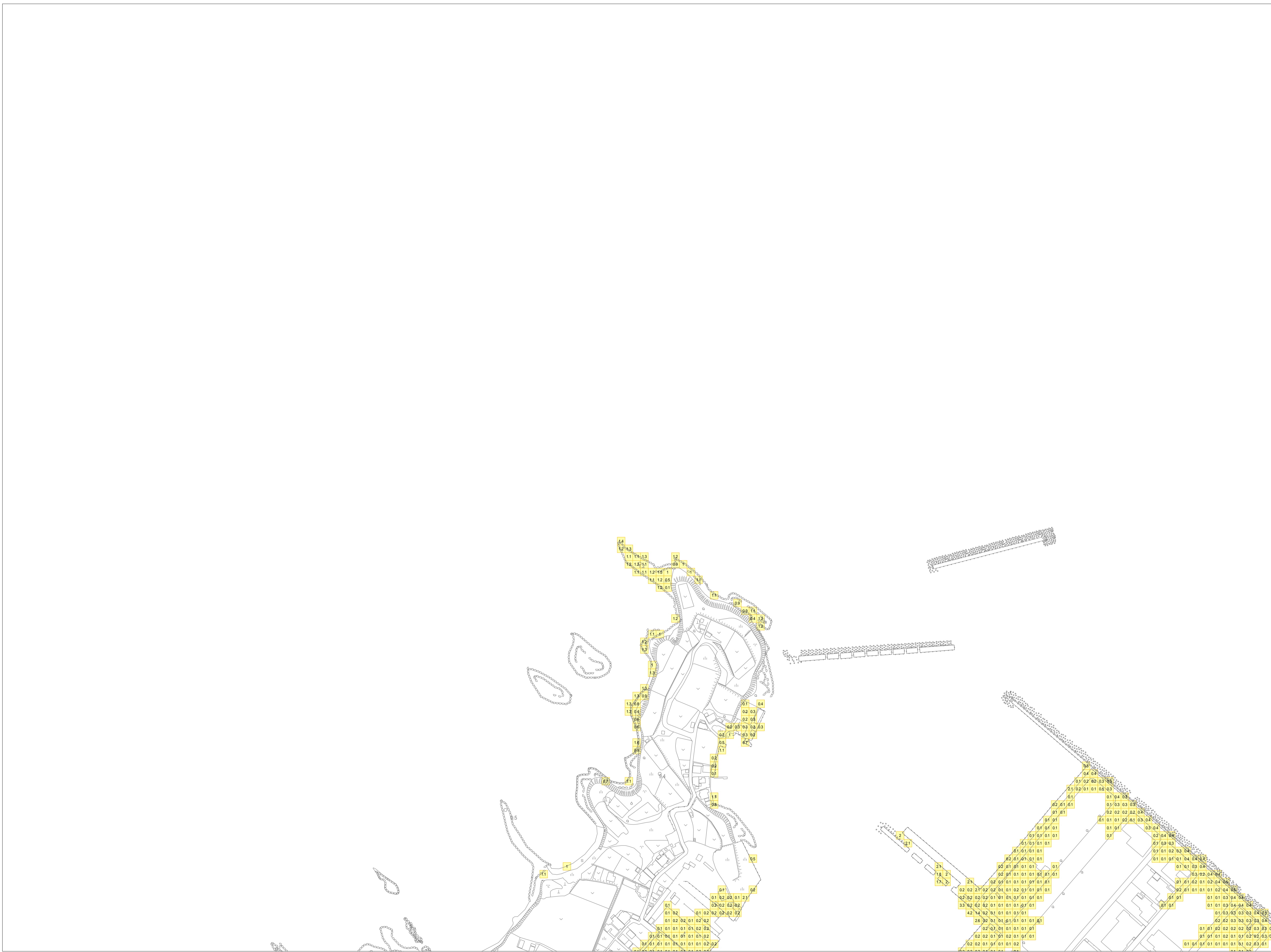
この地図の作成に当たっては、下関市長の承認を得て、同市発行の都市計画図を使用したものである。(承認番号 下都第1508号)