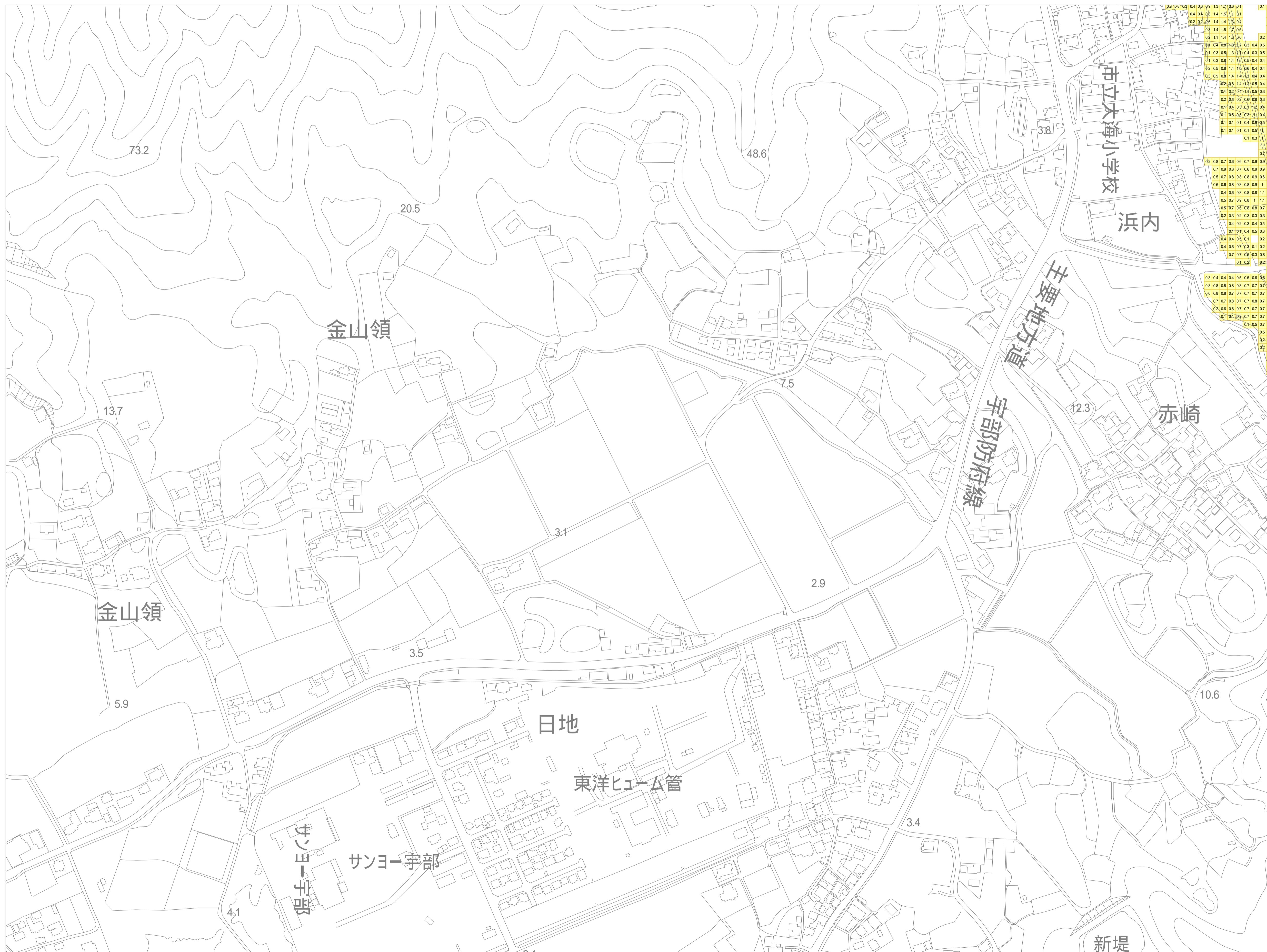
この地図は、山口市長の承認を得て、同市発行の山口市都市計画図を複製したものです。(承認番号 平成25年12月2日 都第177号)