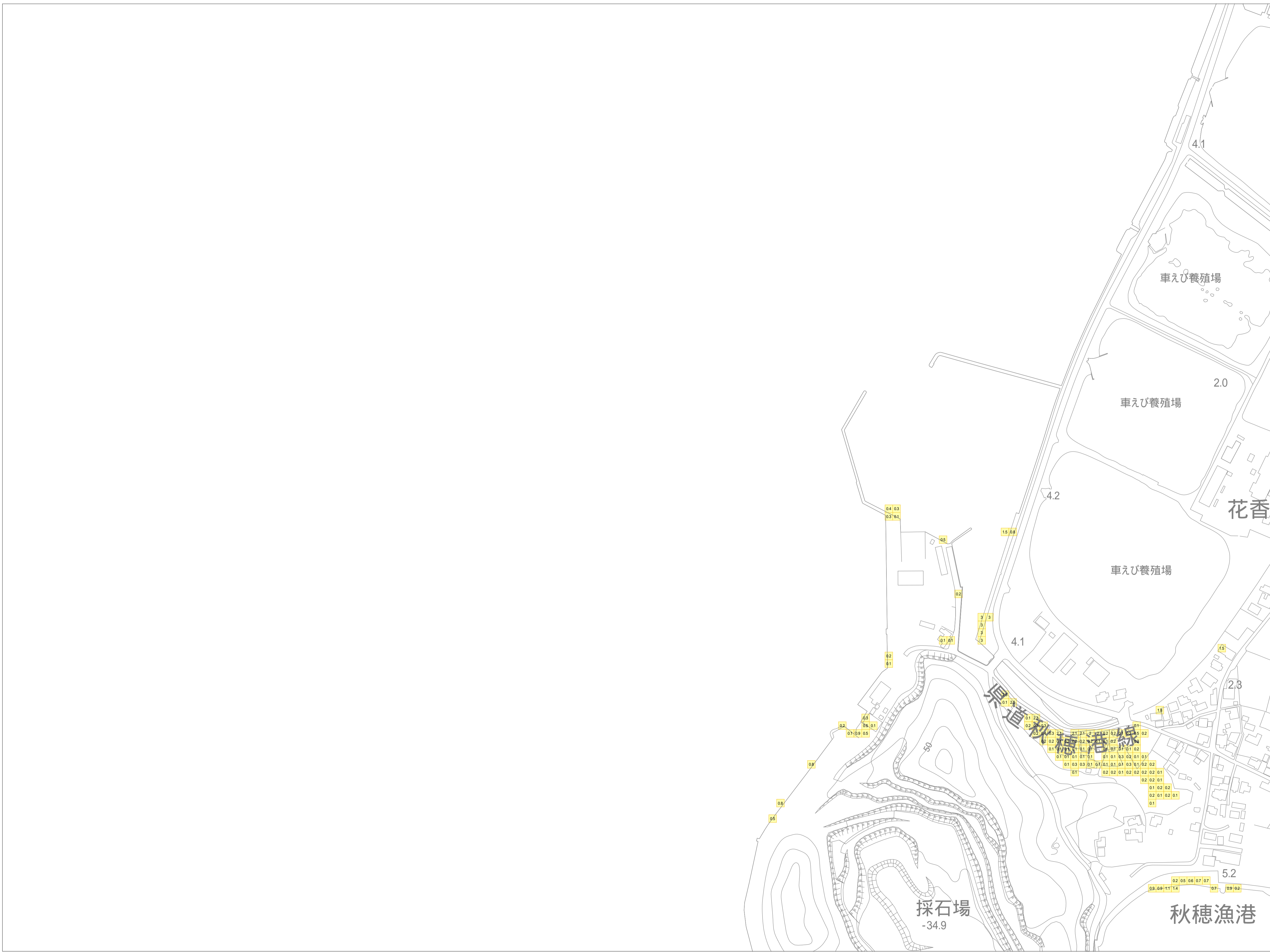
この地図は、山口市長の承認を得て、同市発行の山口市都市計画図を複製したものです。(承認番号 平成25年12月2日 都第177号)