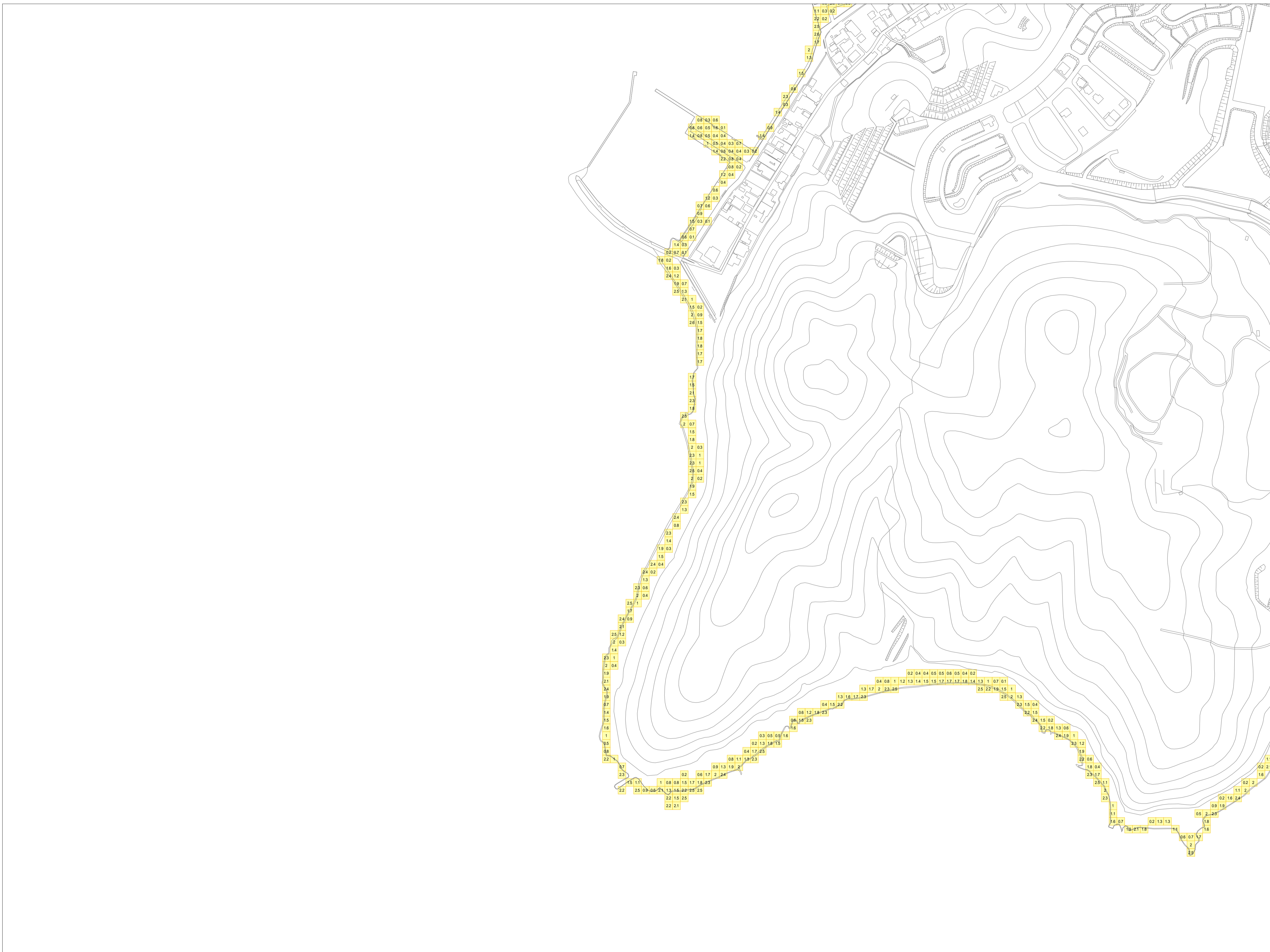
この地図データは、防府市長の承認を得て防府市地形図を使用したものである。