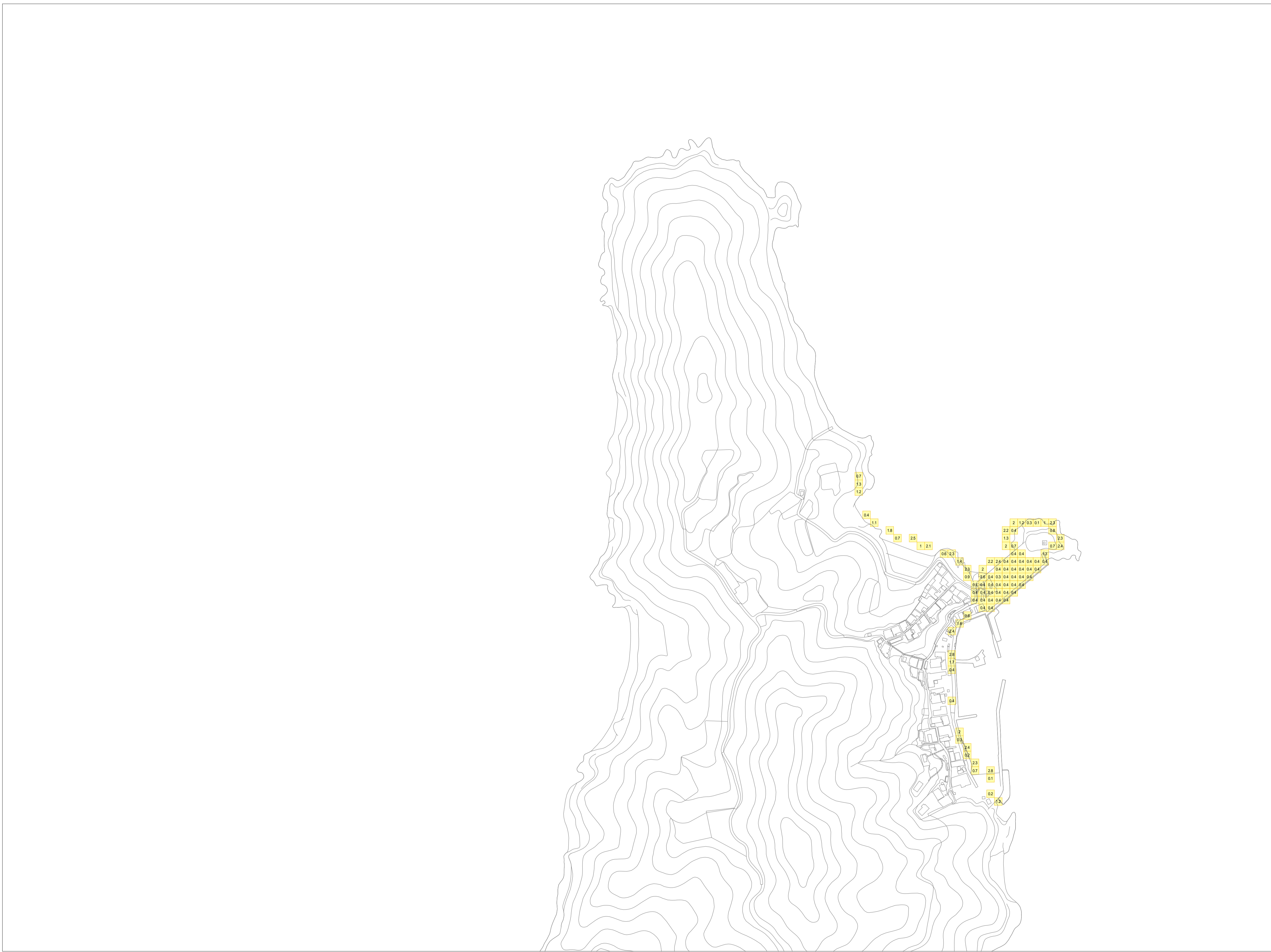
この地図は、岩国市長の承認を得て岩国市都市計画図を使用したものである。