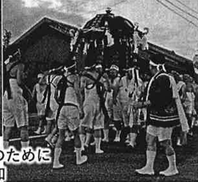
7月 文化財保護、継承推進のために 山口祇園祭振興会に参加