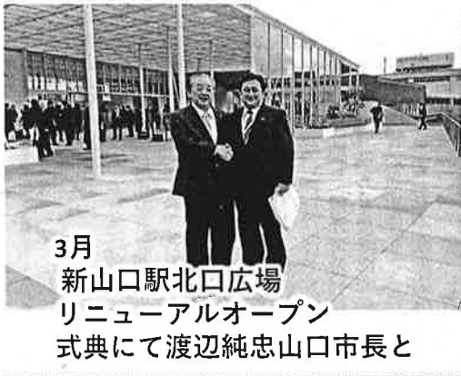
3月 新山口駅北口広場 リニューアルオープン 式典にて渡辺純忠山口市長と