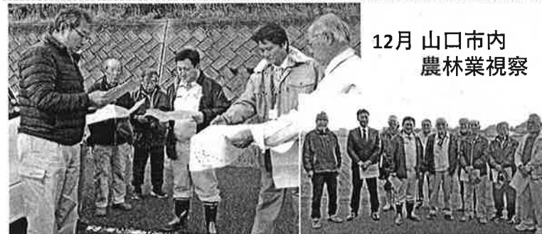
12月 山口市内 農林業視察