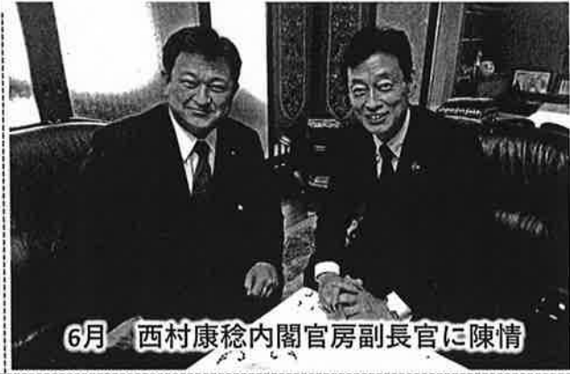
6月 西村康稔内閣官房副長官に陳情