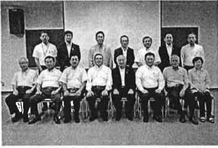
7月 県内企業・山口ゆめ花博会場視察