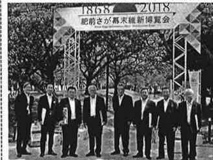
8月 県議会総務企画委員会 九州視察