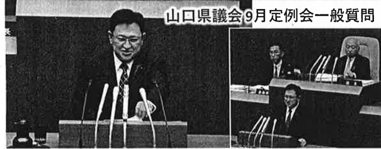
山口県議会9月定例会一般質問