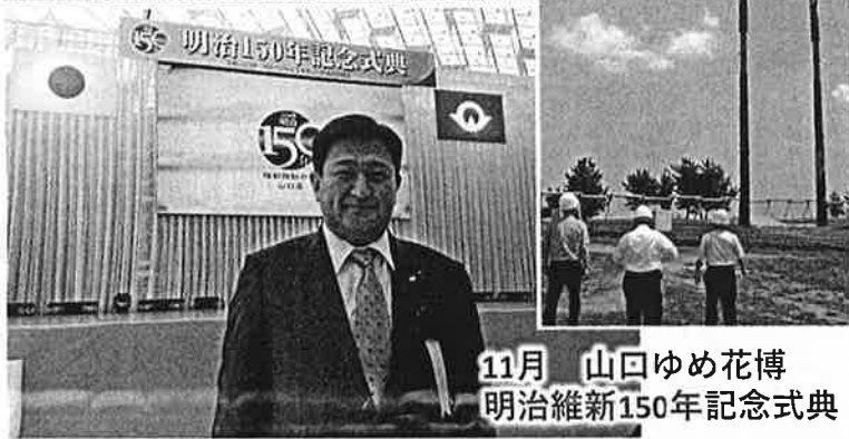
11月 山口ゆめ花博 明治維新150年記念式典