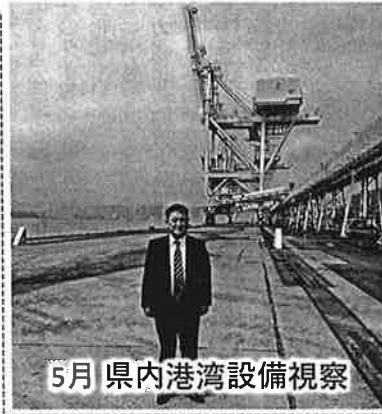
5月 県内港湾設備視察