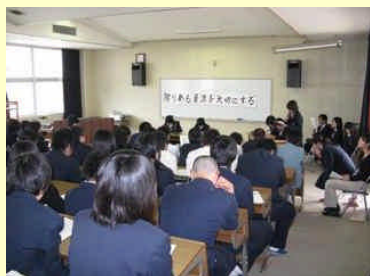
行動宣言・環境教育講座