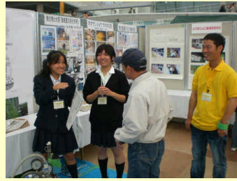
エコフェアのブースでの展示