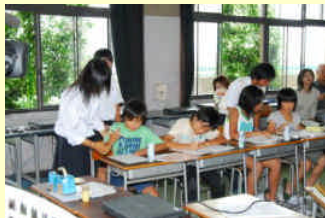
小学生との環境学習