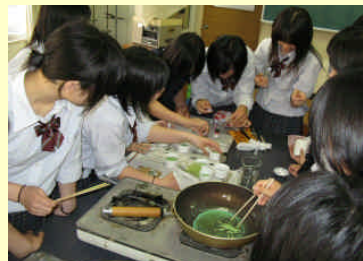
廃油でつくるろうそく