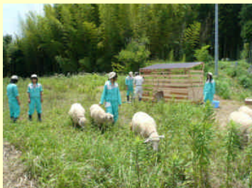
羊を放牧して農地の荒廃を防ぐ研究