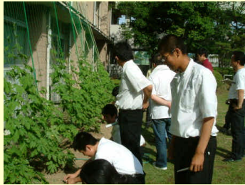
緑のカーテン・ミスト発生装置