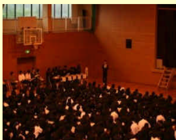
生徒総会での活動宣言