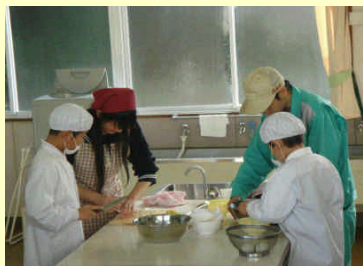
地域の小学校と連携