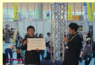
高校生環境ミーティング