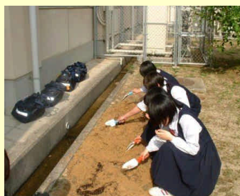
めざせマイナス6%運動