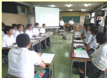
地域環境ミーティング