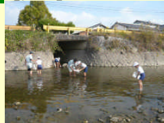
田布施川水生生物調査