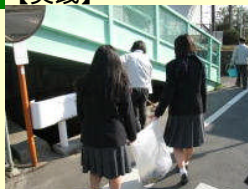
地域ボランティア