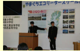
宇部エコフェスタ2012での発表