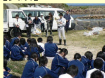
役場職員からの鳴き砂の説明