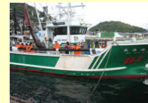
実習における浜環境教育