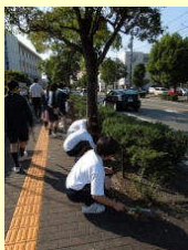
地域清掃ボランティア