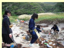
二位ノ浜の海岸清掃