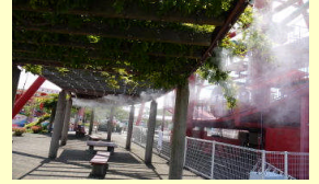
ときわナイトフェスタへのミスト装置貸出