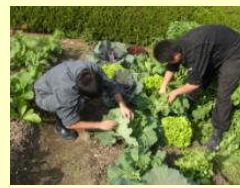
コンパニオンプランツ