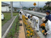
地域の花壇づくり