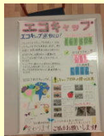
エコキャップ回収ポスター