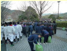
高校生地域環境ミーティング