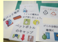
情報Aの授業で作成したポスター