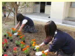
ガーデニングに挑戦