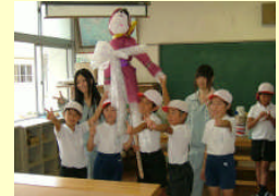
小学生と連携した食農教育