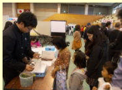
山口県ものづくりフェスタ