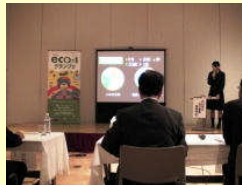
エコ1グランプリ出場