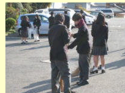
地域ボランティア