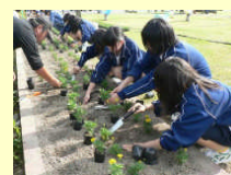
道の駅「なご」の花壇整備