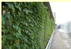
グリーンカーテン