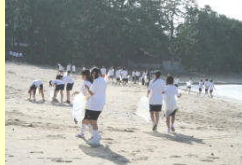
菊ヶ浜清掃ボランティア