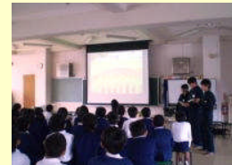
小学校での地産地消講話