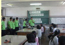
地球温暖化対策教室