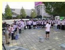
幸せます 町づくり運動