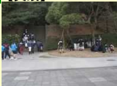
永源山公園エコ活動