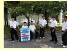
簡易型ミスト発生装置