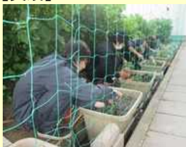
グリーンカーテン植付