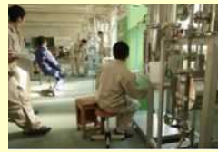
バイオエタノール製造装置