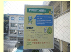
エコ週間ポスター（生徒作品）