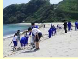
二位ノ浜の海岸清掃