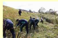
山焼きの火道切り