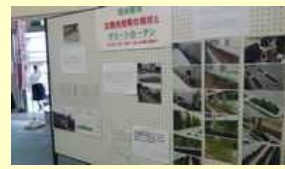
天神まちかどフェスタ 展示パネル