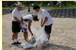
ラグビー部による長田海岸清掃