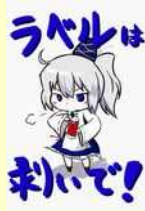
ゴミ分別ポスター