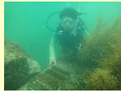
実習における藻場再生活動