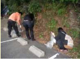
学校周辺の清掃活動