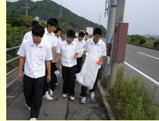
通学路等地域清掃