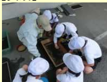
イネの有機無農薬栽培