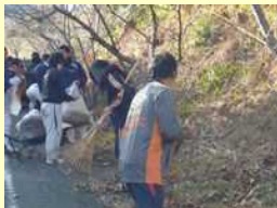
地域ボランティア