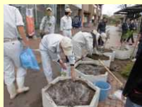
東萩駅の美化活動