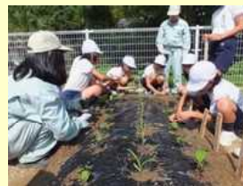
小学校でのものづくり教育