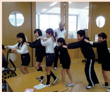
休憩時間での交流