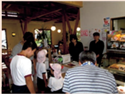
地域の店舗での野菜の模擬販売