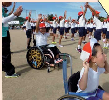
小学校の運動会に参加

【長門分教室教員より】 行事や参観日を通して、小学校の保護者へも理解が広がっています。日常的に小学校の先生と打合せや情報交換等、細かな連携を図ることができます。