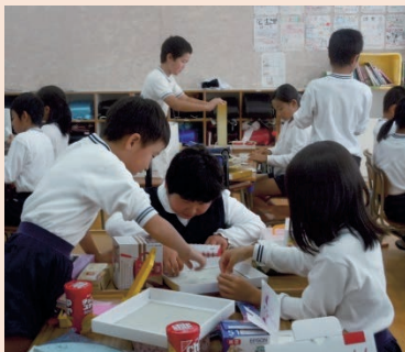
図画工作科の授業

長門分教室は、地域の小学校内に設置されており、日常的な触れ合いの機会が子どもたちの相互理解につながっています。