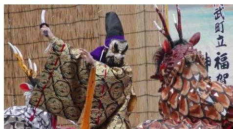
伝統芸能継承の取組