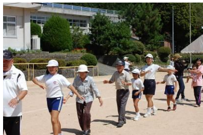
福賀地区秋季大運動会