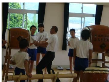
福賀ふるさと夢太鼓の取組

かつての福賀地域は自治会ごとに得意の神楽の演目を持ち、神社の祭礼や農作業の節目ごとに数少ない地域の娯楽として演じてきました。中学校では、金社神楽保存会の協力を得ながら、昭和40年代からはクラブ活動として、現在は総合的な学習の時間の一環として位置付け、活動を続けてきました。生徒数の減少から、演目は古事記にそのルーツを見いだす「大蛇」と、五穀豊穡の神に豊作を祈願・感謝する「四神」に絞り、地域の歴史や文化の理解を深める役割も果たしています。