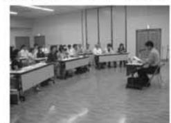
4校合同での研修会の様子

校区の 4 校の教職員が一堂に会し、人権教育や綱紀保持、小・中学校の連携について協議し、子どもに身につけさせたい力や、各学校での様々な取組の情報交換、小・中学校間の相互の授業参観、出前授業等を実施しています。