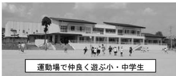
運動場で仲良く遊ぶ小・中学生