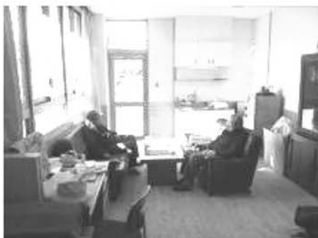
学校の地域連携室