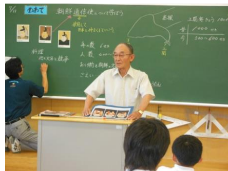
ゲストティーチャー

小学6年生の社会科の授業では、朝鮮通信使に詳しい地域の方をゲストティーチャーにお招きし、授業をしていただきました。児童たちは本町とかかわりの深い朝鮮通信使についての話を興味深く聞き、郷土の歴史へ関心を高めることができました。