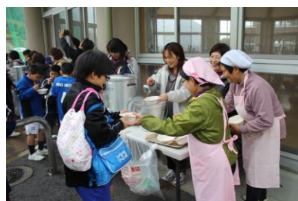
「愛・ランド走ろう大会」

駅伝の企画・運営や中継所等の役員を町内の様々な団体が役割分担して実施しています。このように、中学校だけでは難しい行事も地域の方々の協力のお陰で、実施可能となっています。中学生の部の他、一般や小学生・未就学児も出場できる部門もあり、地域ぐるみでこの行事を盛り上げています。大会後は、婦人会が作った豚汁を子ども会のお世話でおいしくいただきました。