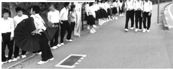
「あいさつの日」の取組（鴻南中）