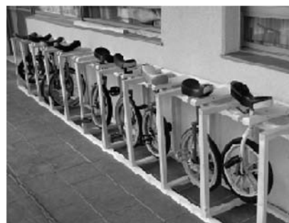
使いやすく整理されました