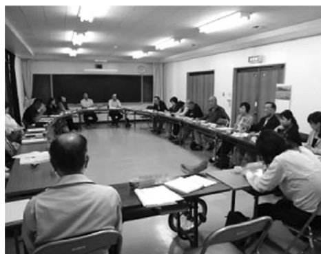
厚陽校区地域教育協議会

今後は「どの活動を、どの場面で支援していくか」といった支援の在り方について、学校とコーディネーター、地域関係者の間でよく協議しながら、地域の教育力をより一層生かしていくことが求められます。