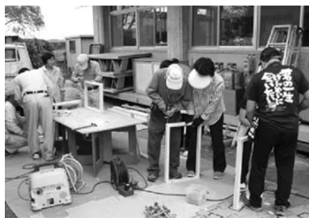
一輪車整理台の製作