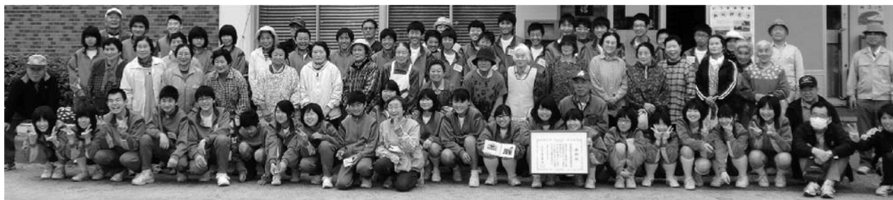
「厚陽地区緑と花の推進協議会」の皆さんと記念撮影