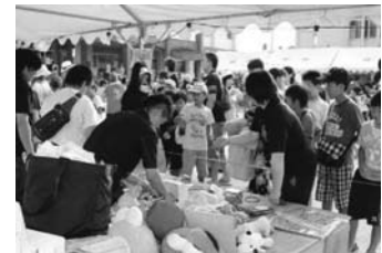
「誠意小夏祭り」模擬店