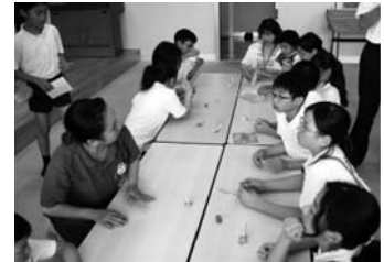
室津小「箸おき」づくり