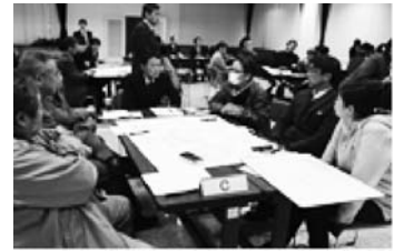
豊洋中学校区「熟議」