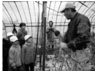
さよならピーマン