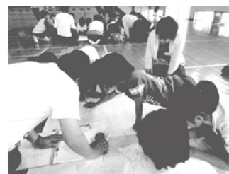
防災マップ作りの様子

城山小学校は、平成24年度に山口県教育委員会の「実践的防災教育推進校（地震・津波災害）」に指定され、地域ぐるみで防災教育に取り組んできました。防災教育を実践する時には、常に保護者や地域との連携を意識し、防災のために多くの人々が関わってくださっていることを子どもに伝え、防災に関する意識が高まるようにしました。