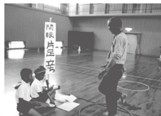
お年寄りの体力測定の様子