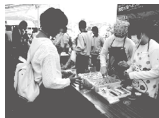
クッキー販売の様子

東和中学校は、キャリア教育の一環として起業家体験学習に取り組みました。東和地区の特産物である「東和金時」に着目して商品開発をした班は、菓子製造販売をする方法を学び、地域の人々の協力を得ながら東和金時クッキーを販売しました。ルーラル・オレンジ・フェス当日は、約600個のクッキーがあつという間に完売し大盛況でした。