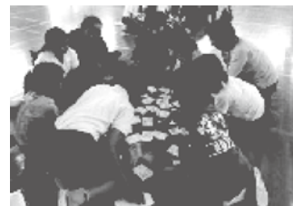
「防災カルタ」遊びの様子

また、子どもが保護者・地域の方と相談しながら防災安全マップ作りをしたり、「ふれあいの会」において、手作りの「城山小防災カルタ」をしたりする等、防災への意識が継続する取組をしました。これらの取組を通して、子どもの地震・津波災害に対する心構えができたとともに、保護者や地域と連携した活動をしたことにより、地域における防災意識も高まりました。