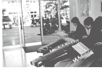
文化祭での箏の演奏