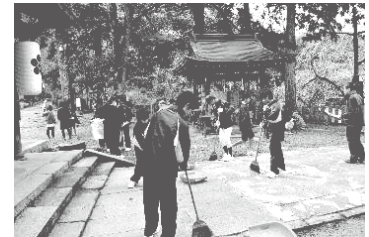
文化財清掃ボランティア