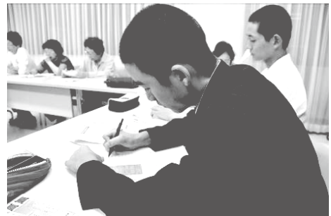
大殿ふるさとまつり実行委員会

大殿地域協育ネットのより効果的な運営・活用と地域コーディネーターの後継者養成は引き続き重要な課題です。