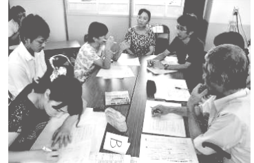
夏の小中合同研修会