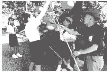
大殿セタちょうちんの灯

一の坂川清掃や文化財清掃 夏休み宿題やっつけ隊 大殿地区敬老会 ロードレース大会 等