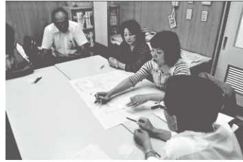
学校運営協議会での熟議