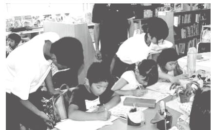
夏休み宿題やっつけ大作戦

今後は、大殿地域で学び、ふるさとを愛し、将来、この地を支えていこうとする人材をいかに育てるか、地域全体で考えていくことが大切です。また、地域づくりの核となる小・中学校をめざして、地域の方が集い、趣味や特技でつながることで大人同士の新たな関係性が生まれるような企画を考えていきたいと思ひます。