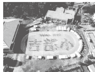
記念行事の人文字

吉部小学校では、開校 140 周年を記念して学校運営協議会を中心に記念行事を計画し、地域との合同運動会の際に地域の方にも協力していただき人文字を写真撮影しました。この写真を記念の下敷きとして校区の全世帯に配布し、地域の方に喜んでいただきました。