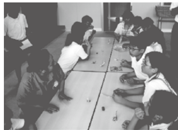
室津小「箸おき」づくり