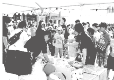
「誠意小夏祭り」模擬店