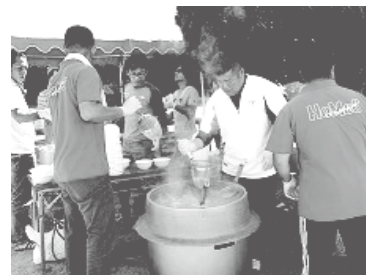
豊洋中学校文化祭バザー