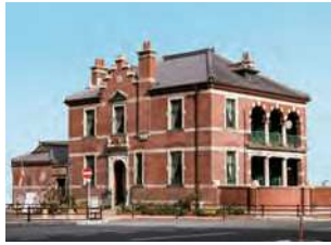
山口県下関市唐戸町4-11