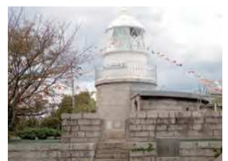
山口県下関市六連島

大坂条約の約定に基づき関門海峡西端に設置された、R. H. ブラントン設計の洋式灯台。明治4年11月（1872年1月）に初点灯した。