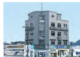
山口県下関市唐戸町6-2

門司港唐戸間の連絡船を運航する関門汽船株式会社が昭和6（1931）年に建設した事務所ビル。