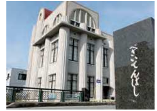
山口県下関市田中町5-7