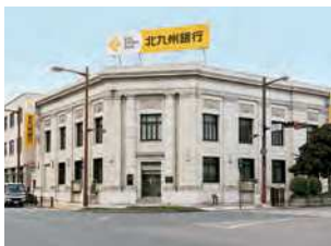
福岡県北九州市門司区清滝2-3-4

貿易融資や外国為替を専門に扱った横浜正金銀行の支店。鉄筋コンクリート造2階建。昭和9（1934）年竣工。