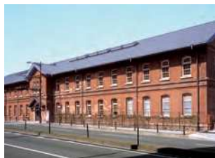
福岡県北九州市門司区清滝2-3-29

明治21（1888）年に設立された九州鉄道の本社屋。明治24（1891）年竣工。