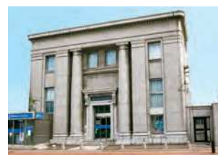
山口県下関市南部町21-23