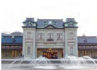
福岡県北九州市門司区西海岸1-5-31

門司駅の2代目駅舎として、大正3(1914)年に建築された木造モルタル塗の建物。