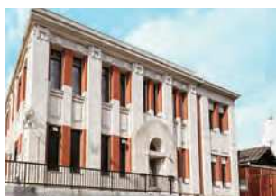
山口県下関市岬町13-7

旧東洋捕鯨株式会社下関支店として大正15（1926）年に建設され、それ以来捕鯨活動の拠点となった建物。