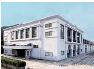
福岡県北九州市門司区西海岸1-3-5

中国・大連をはじめ、世界各地を結ぶ国際航路の旅客ターミナルとして建てられた。昭和14（1929）年竣工。