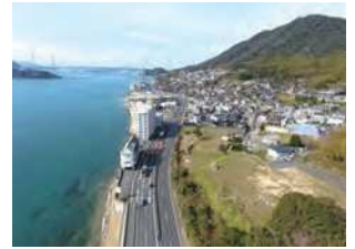
山口県下関市前田1-7