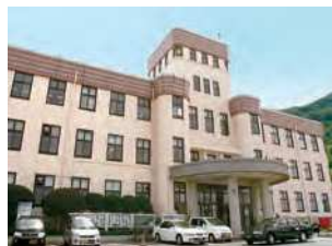
福岡県北九州市門司区清滝1-1-1

モダンな外観デザインを有する旧門司市庁舎。鉄筋コンクリート造3階建。昭和5（1930）年竣工。