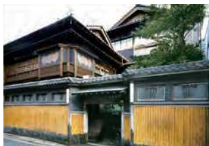
福岡県北九州市若松区本町2-4-22