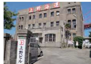
福岡県北九州市若松区本町1-10-17