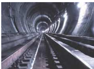
福岡県北九州市/山口県下関市