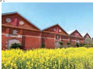
福岡県北九州市門司区大里元町2-1

鈴木商店が明治時代末に起業した大里製粉工場の倉庫。ニッカウキスキーの倉庫として今も使われ続けている。