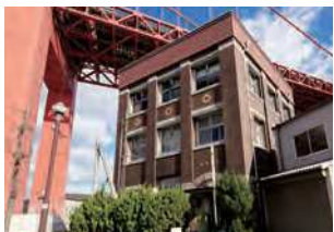
福岡県北九州市若松区本町1-15-10

造船と船舶代理業を行う枋木商事の本社ビル。当時としては珍しい半地下室、自家用浄化槽等を備える鉄筋コンクリート造3階建。大正9年(1920)竣工。