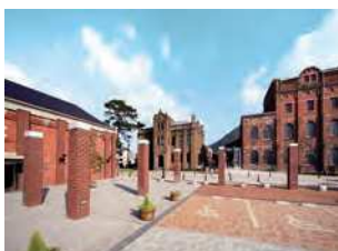
福岡県北九州市門司区大里本町3-6-1

明治45（1912）年に設立した「帝国麦酒株式会社」の工場として建設。事務所棟と醸造棟は大正2（1913）年竣工。