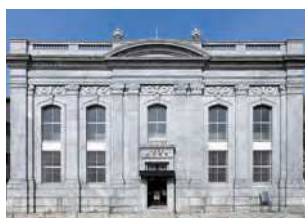
山口県下関市観音崎町10-6

明治9(1876)年に関門地域に進出した三井銀行が、下関支店として大正9(1920)年に新築した建物。昭和8(1933)年の百十銀行本店を経て、昭和19(1944)年から昭和40(1965)年まで山口銀行本店として使用された。