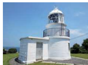
福岡県北九州市門司区大字白野江

旧暦明治5年1月（西暦1872年3月）に初点灯した灯台。関門海峡西口にある六連島灯台とほぼ同じ設計で、同じ時期に設置された双子灯台。