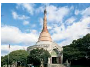
福岡県北九州市門司区門司3251-4

昭和33（1958）年、日本で唯一ミャンマー仏教に認められたミャンマー式寺院として門司の和布刈公園内に建てられた。第二次世界大戦の戦没者の慰霊や日本・ミャンマー両国の親善、世界平和を目的としている。