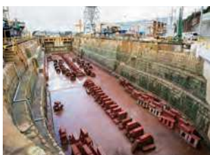
山口県下関市彦島江の浦町6-16-1

大正3（1914）年山口県下関市彦島に設立した造船所。第3ドックは大正11（1922）年竣工の石造で、第4ドックは大正5（1916）年竣工の石造。