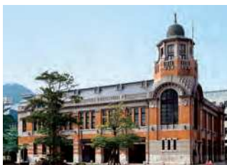
福岡県北九州市門司区港町7-18

大正6(1917)年に竣工した木造、一部煉瓦型枠鉄筋コンクリート造2階建の大阪商船の社屋。門司港を大陸航路の一大拠点とした。