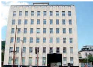
福岡県北九州市門司区西海岸1-6-2

門司港に進出した三井物産の三代目にあたるオフィスビル。門司における近代化のプロセスを示す合理主義に基づいた建造物。昭和12(1937)年竣工。