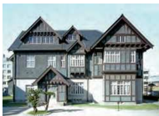
福岡県北九州市門司区港町7-1

門司に進出した商社・三井物産門司支店が接客や宿泊用に建設した施設。木造2階建、大正10(1921)年竣工。北九州における大正期の近代化を示す建物。