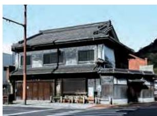
福岡県北九州市門司区東本町2-6-24

明治32（1899）年から門司港地区で酒類販売を行ってきた岩田家の店舗兼住宅。木造2階建。大正10（1921）年上棟。