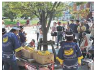
福岡県北九州市/山口県下関市

大阪商船や日本郵船により台湾航路が確立し、安定して大量のパナナが関門港に輸入されるようになった。軽妙な売り口上による掛け合いは「パナナの叩き売り」として定着し、現在も関門の風物詩となっている。