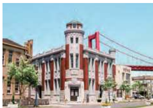
福岡県北九州市若松区本町1-11-18