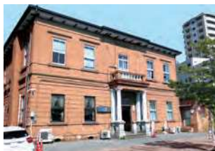
福岡県北九州市若松区本町1-13-15