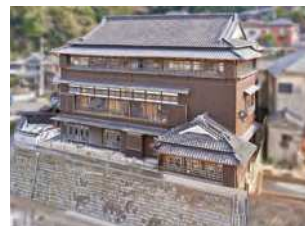
福岡県北九州市門司区清滝3-6-8

経済発展を遂げた門司港を代表する大型旅館。現存する料亭の建屋としては、九州最大の木造3階建。昭和16（1931）年竣工。