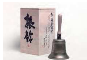
山口県下関市竹崎町4-3-1(下関駅内)

JR下関駅開業当初から使われ続け、火災で焼失したと思われていた大型のハンドベル。