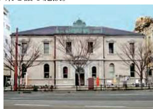
山口県下関市南部町22-8