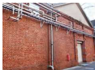
福岡県北九州市門司区大里元町2-1

鈴木商店が大正3（1914）年に創設した焼酎工場。当時は朝鮮や中国向けに輸出する焼酎を製造していた。