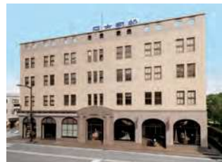
福岡県北九州市門司区港町7-8

日本郵船門司支店として建てられた、門司港駅(旧門司駅)の正面にあるオフィスビル。鉄筋コンクリート造4階建。昭和2(1927)年に竣工。現在は門司郵船ビルとして機能している。