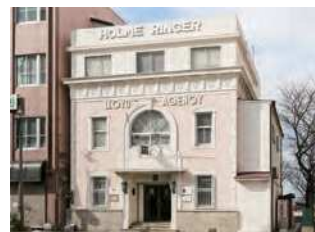
福岡県北九州市門司区港町9-9

明治の日本の貿易に大きく貢献した、イギリス人貿易商が長崎で設立した会社「ホーム・リング商会」の系譜を受け継ぐ、淡い色使いが印象的な建築物。昭和37(1962)年竣工。