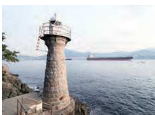
山口県下関市大字彦島金ノ弦岬

明治4（1871）年に設置された関門海峡の礁標を大正9（1920）年に移築した灯台。平成12（2000）年に廃止されるまで、関門航路を照らした。