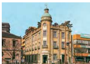
山口県下関市南部町23-11