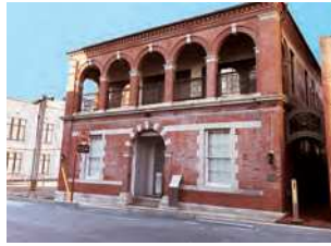
山口県下関市田中町4-10