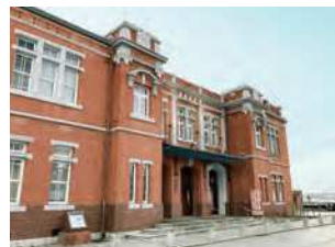
福岡県北九州市門司区東港町1-24

門司税関が発足したのを契機に、明治45（1912）年に建設された税関庁舎。煉瓦造り瓦葺2階建。昭和初期まで税関庁舎として使用される。