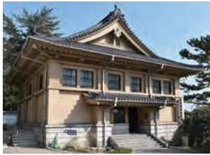
山口県下関市阿弥陀寺町4-3

昭和12（1937）年に下関市が建設した日清講和会議や下関条約に関する記念館（下関市立歴史博物館分館）。