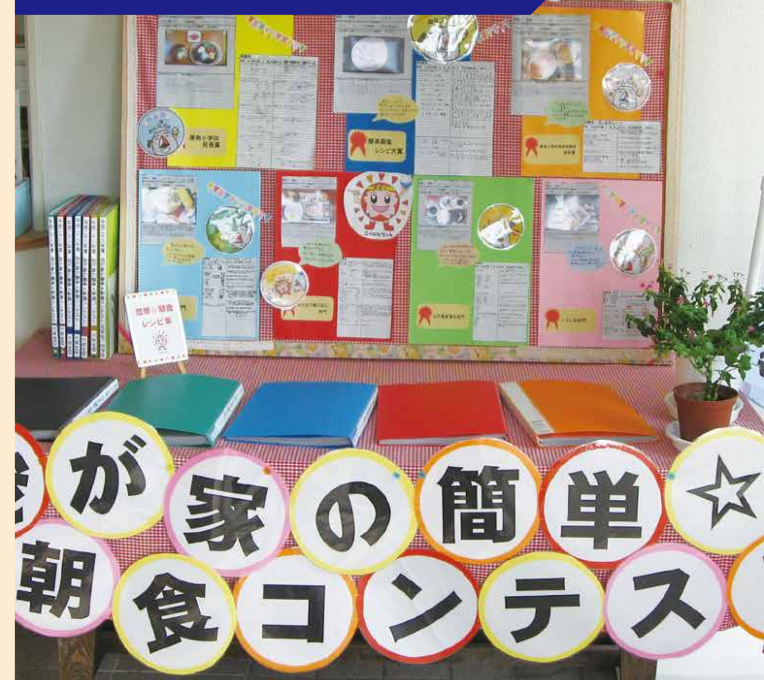
児童・生徒が主体的に参画する取組

児童・生徒から朝食レシピを募集し、学校運営協議会でコンテストを行っている。子どもたちの健やかな成長を願って、簡単に作れておいしい、栄養のバランスが考えられた朝食を推進している。