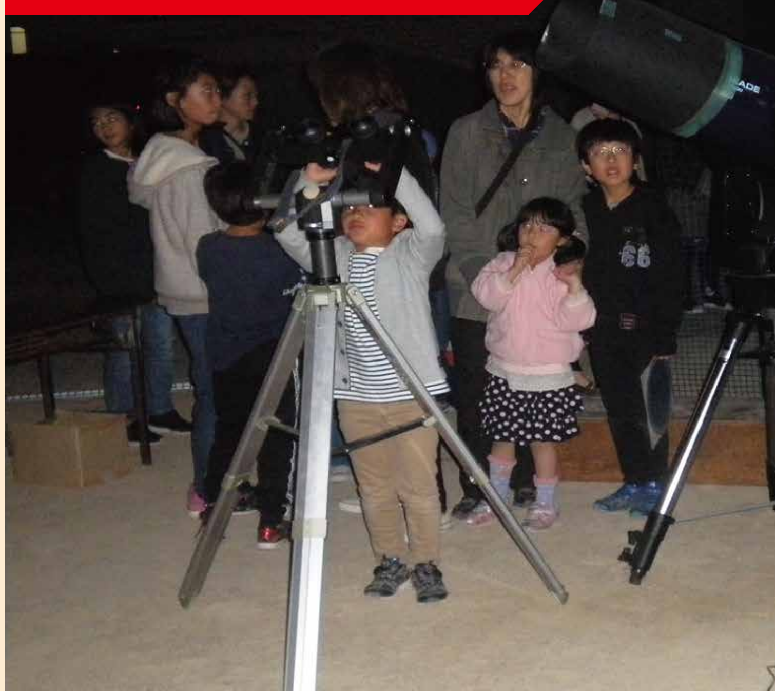
学校と地域の連携を促進する取組

天体観望には絶好の条件の下、「コミスク天体観望会」を開催。約120名の参加者が春の星座や月の観察を楽しんだ。「コミスクカフェ」やプレゼントの「東岐波オリジナル星座早見盤」も大好評だった。