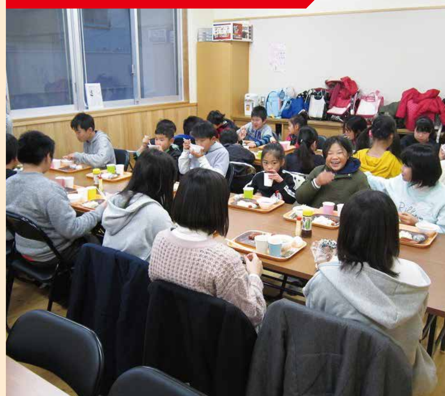
学校と地域の連携を促進する取組

校区社会福祉協議会と連携し、「朝ごはんを食べよう」の取組を実施。みんなで食べることで、朝、食欲のない児童も、たくさん食べることができ、1日の活力源となった。今後も、学期に1回程度実施していく予定。