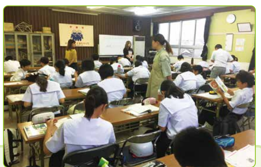
学習支援や学校の環境整備等、様々な場面で地域の方が教育活動を支援し学校と地域との協働活動が進んでいます。