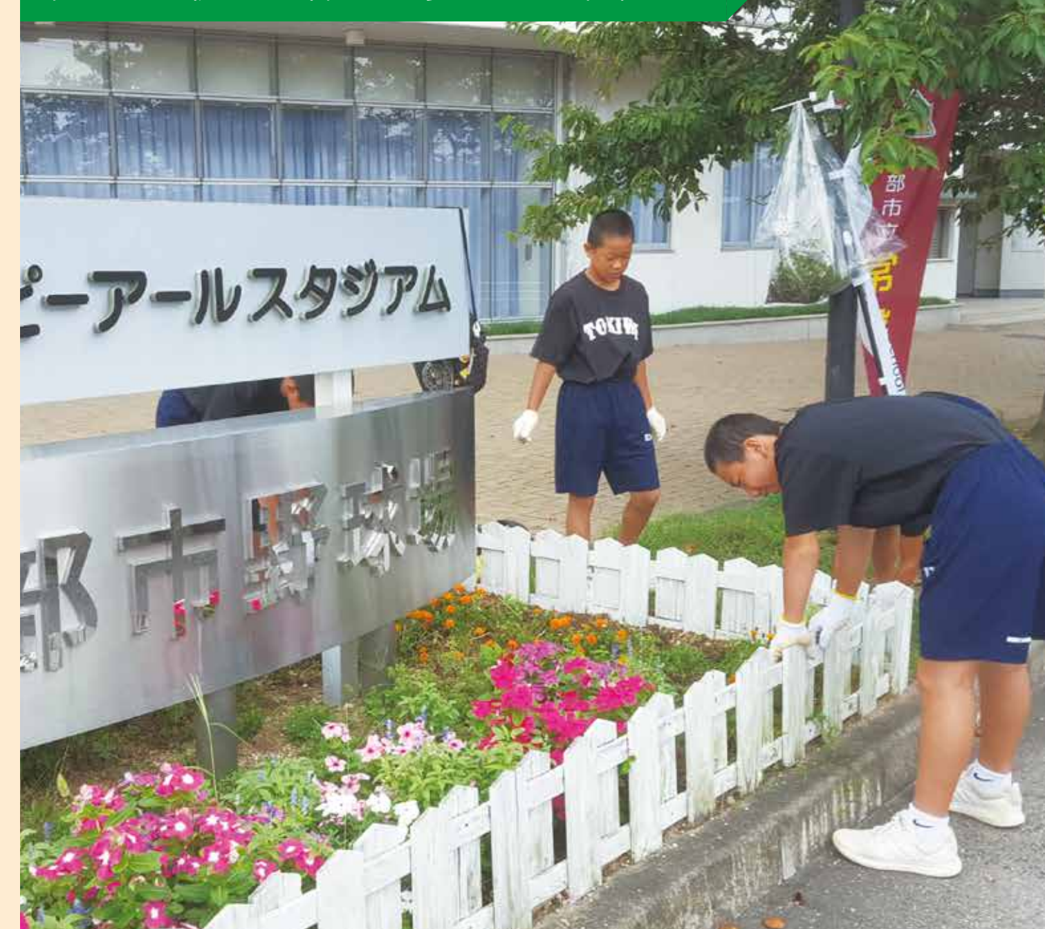
児童・生徒が主体的に参画する取組

夏休み中に本校全ての運動部・文化部が地域の清掃活動等を行った。部活動単位で、活動内容と活動日時を決めて実施した。