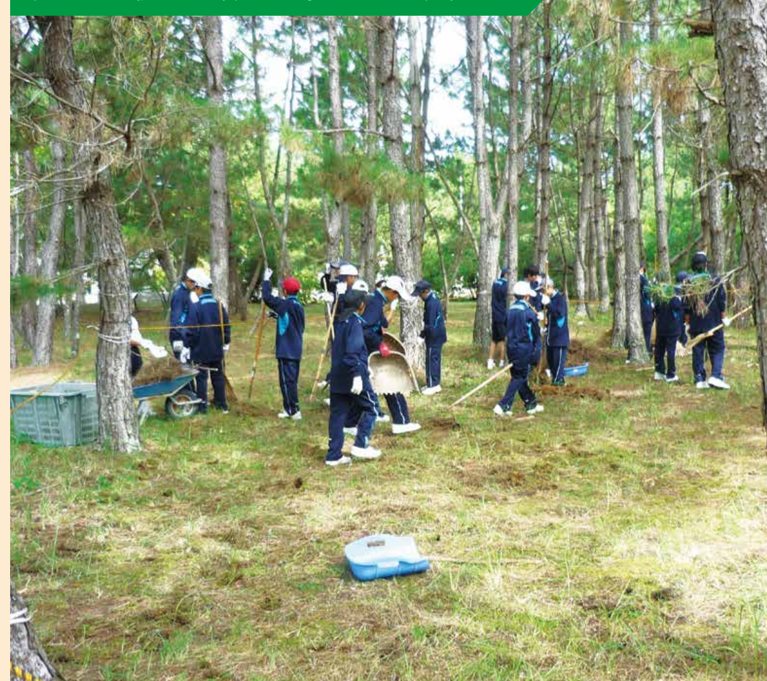
児童・生徒が主体的に参画する取組

地域にある波雁が浜の松林の保全活動を、地域の方と共に行っている。今年度は、小中合同で取り組んだ。地域の財産を生徒は知る機会となり、保存・整備をする意義を知り、ふるさとを愛する思いが芽生えている。