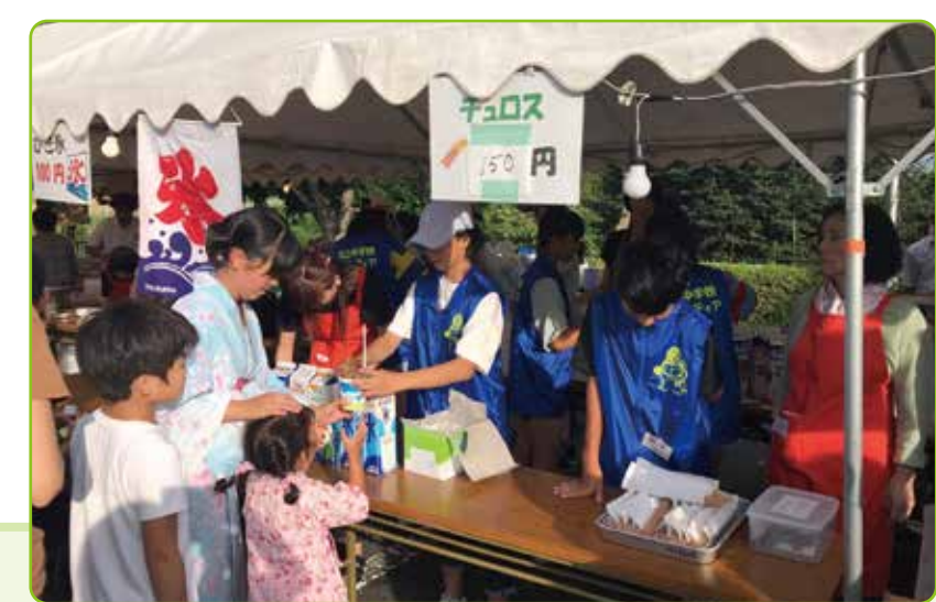
子どもたちがふるさとの行事や環境美化活動等に参画し、地域づくりに貢献することで地域への思いが高まるとともに、地域の活性化につながっています。