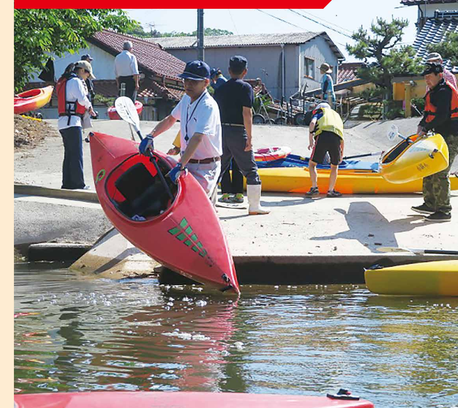
学校と地域の連携を促進する取組

小野地区の自然を生かしたカヌー学習に、毎年度、地域の方々へ支援していただいている。保護者には、陸上からの安全の見守りのためにボランティアを募って協力していただいている。