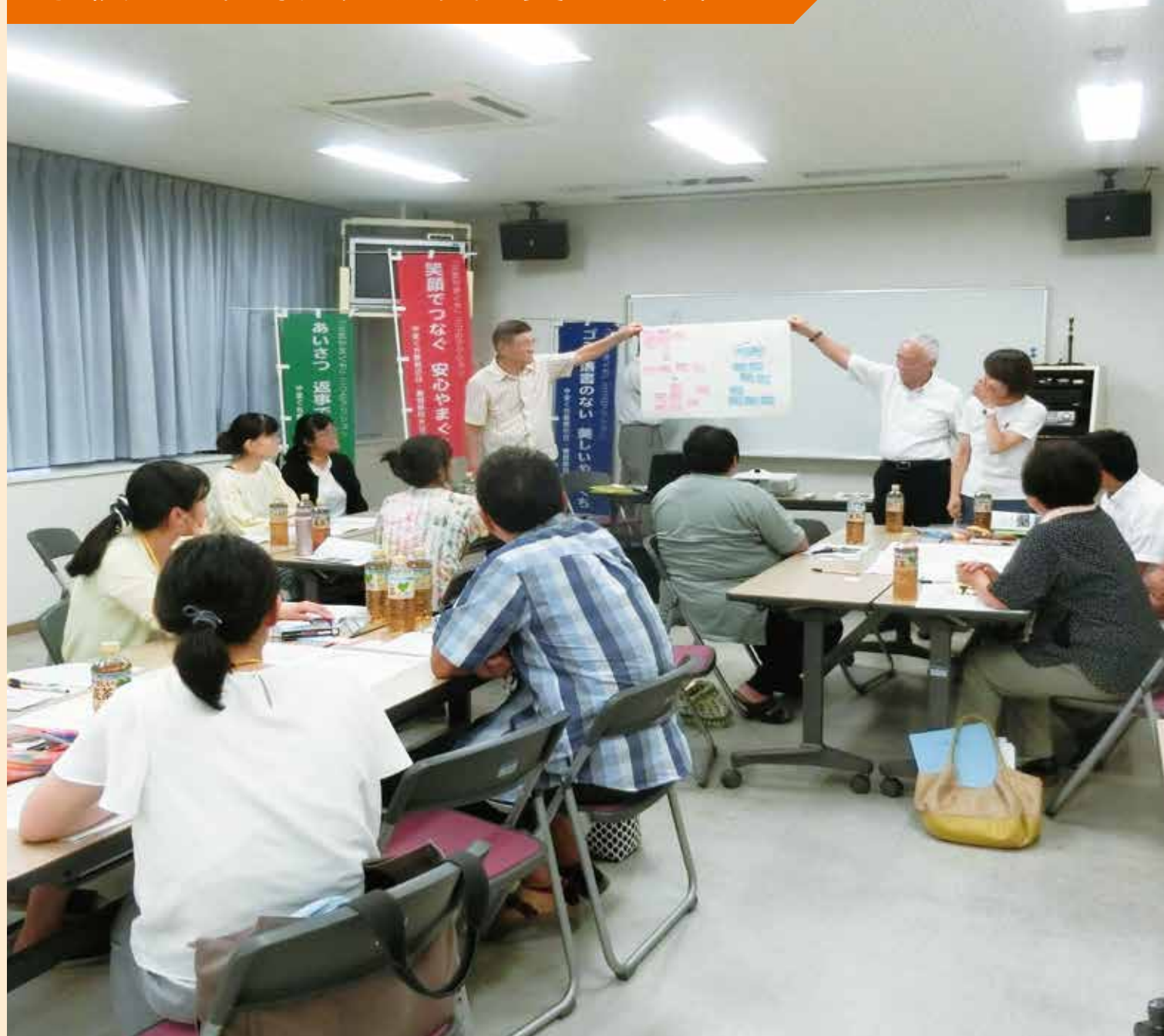
学校運営協議会の充実に資する取組

『ともに伸びる学校』づくりのための熟議を、学校運営協議会委員・保護者・教職員との合同で行った。学校評価で課題に挙げた、読書や新聞と親しむための方策をワークショップ形式で話し合い、全体で共有した。