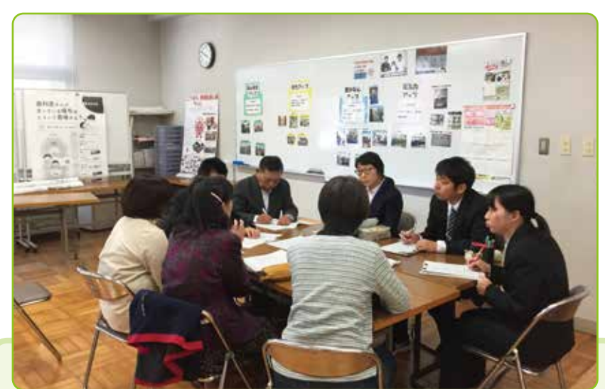
子どもや学校が抱える課題を学校・家庭・地域で共有し、コミュニティ・スクールの取組や質を高めようとする意識が高まっています。