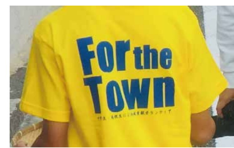
生徒がオリジナルTシャツ作成

「僕たちは地域のために何ができるだろうか」 「僕たちは地域のために何をすべきだろうか」