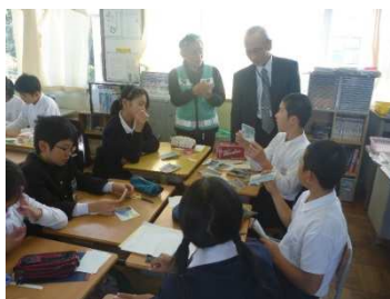
〔安全マップの作成〕