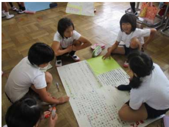
〔壁新聞を作成している様子〕