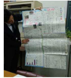
〔4年生が作成した壁新聞を紹介〕

委員会では、城南小学校の今年度実施した各学年や全校での取組の他、取組全体を通じた気づきや感想等を話し合いました。