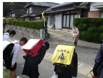
〔子ども110番の家への挨拶〕

お互いが顔見知りになっておくことで、万一の際には、「子ども110番の家」へ、かけこみやすくなりました。