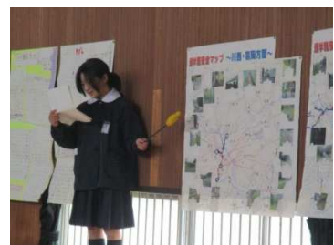
〔児童集会での発表〕