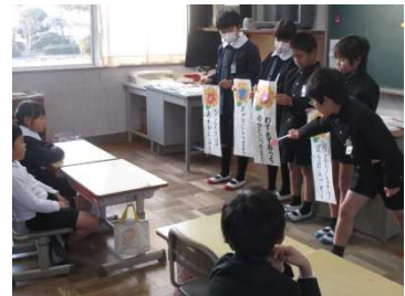
〔下級生へのK Y T学習の実施〕