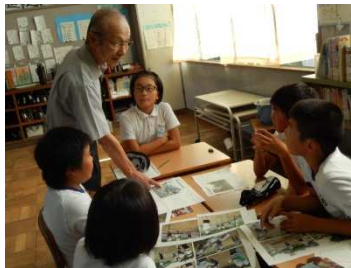
〔K Y Tシートの作成〕