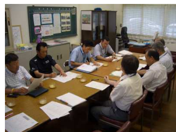
〔第1回実践委員会の様子〕

6月27日城南小学校で、第1回実践委員会を開催しました。年間の取組計画やその際の留意点を話し合うとともに、①児童自身が主体であること②継続可能であること③地域・家庭の力を活用することを基本理念として取組を進めていくことを確認しました。