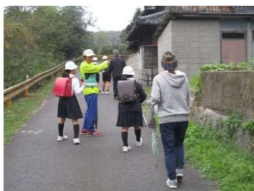
〔通学路危険箇所調査〕

児童集会の学年発表として、全校や各学年の取組、児童による不審者対応避難訓練など劇や資料提示をしながら発表しました。