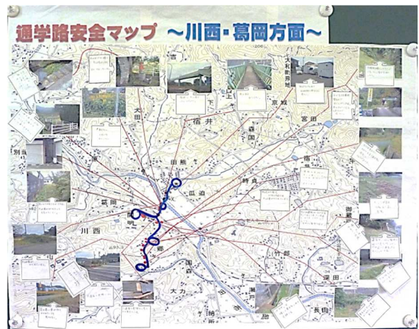
〔通学路安全マップ〕

下校時に撮影・確認した危険箇所や各自の保護者から聞き取った危険箇所を地図上に掲載しました。