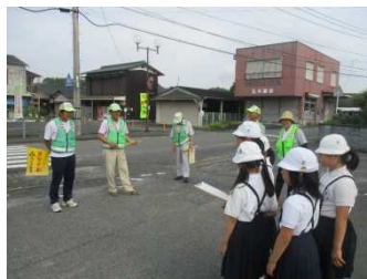
〔防犯パトロール隊へのインタビュー〕