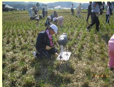
つるのデコイ設置