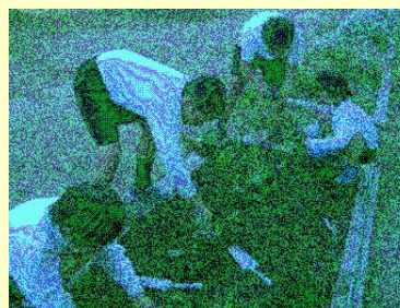
ゴーヤの種のふくろづめ