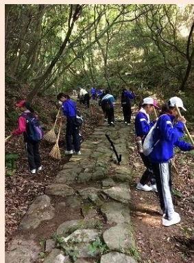
地域とともに千本尼石畳の清掃