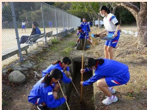
全校での美化活動