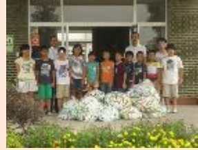
エコキャップの回収