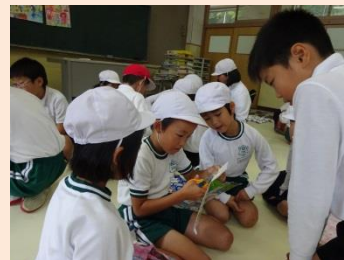
縦割り班で仲良くリサイクル工作