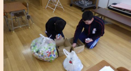
収集したエコキャップの点検