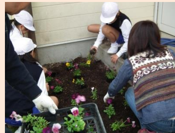
花いっぱい大作戦