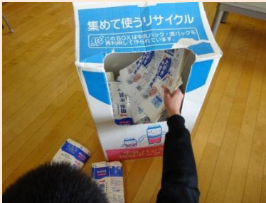
保健委員会によるリサイクル運動