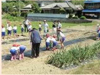
学校園に植え付け