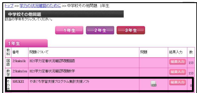
【中学校】その他問題⇒1年生